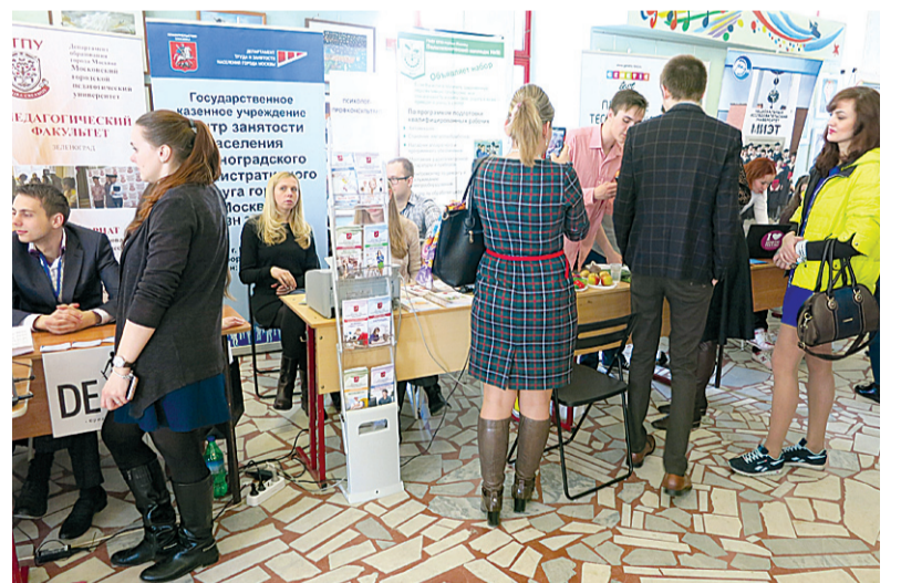
Зеленоградский ЦЗН на фестивале

Зеленоградский ЦЗН принял участие в фестивале «Молодежь и город – 2016», который прошел во Дворце творчества детей и молодежи. Организаторами мероприятия выступили М-Клуб, зеленоградский ДТДиМ, Московский дом общественных организаций.