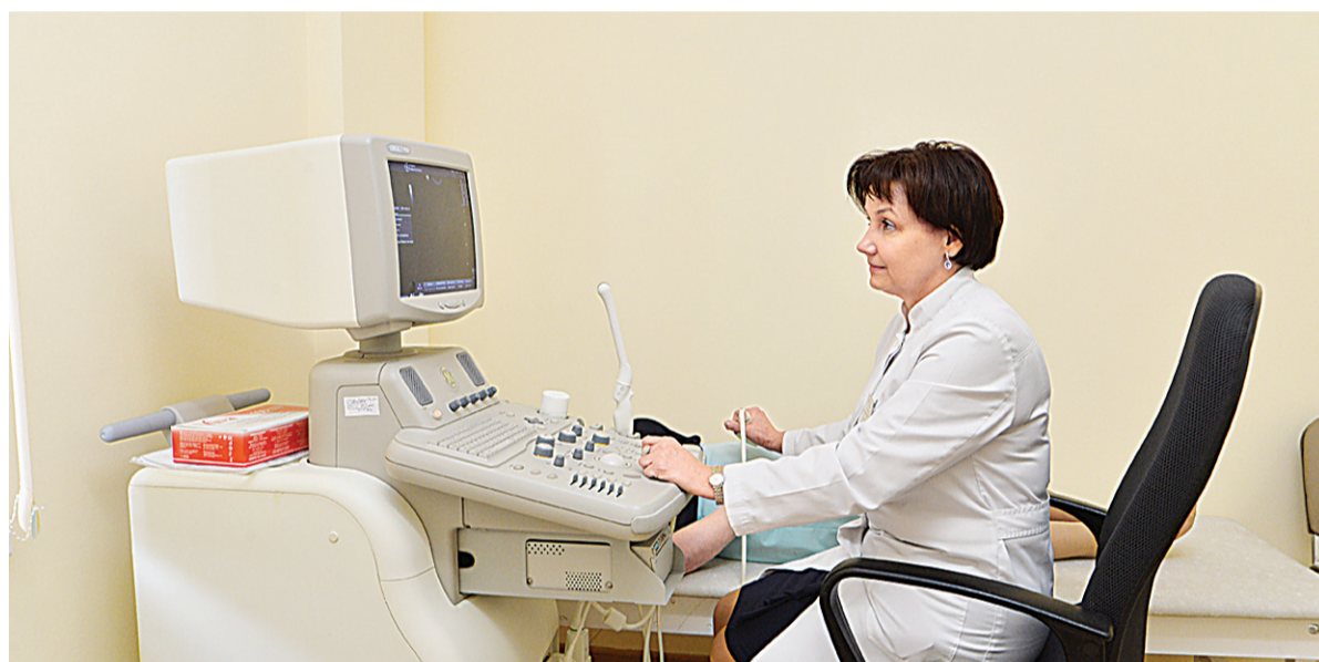
УЗ-диагностика при помощи аппарата экспертного уровня (единственного в Зеленограде)

– Пока в нашем отделении ведется подготовка женщин к ЭКО. Сама процедура производится в нескольких специализированных московских центрах. Вторым этапом станет открытие в филиале «Родильный дом» ГКБ №3 отде-