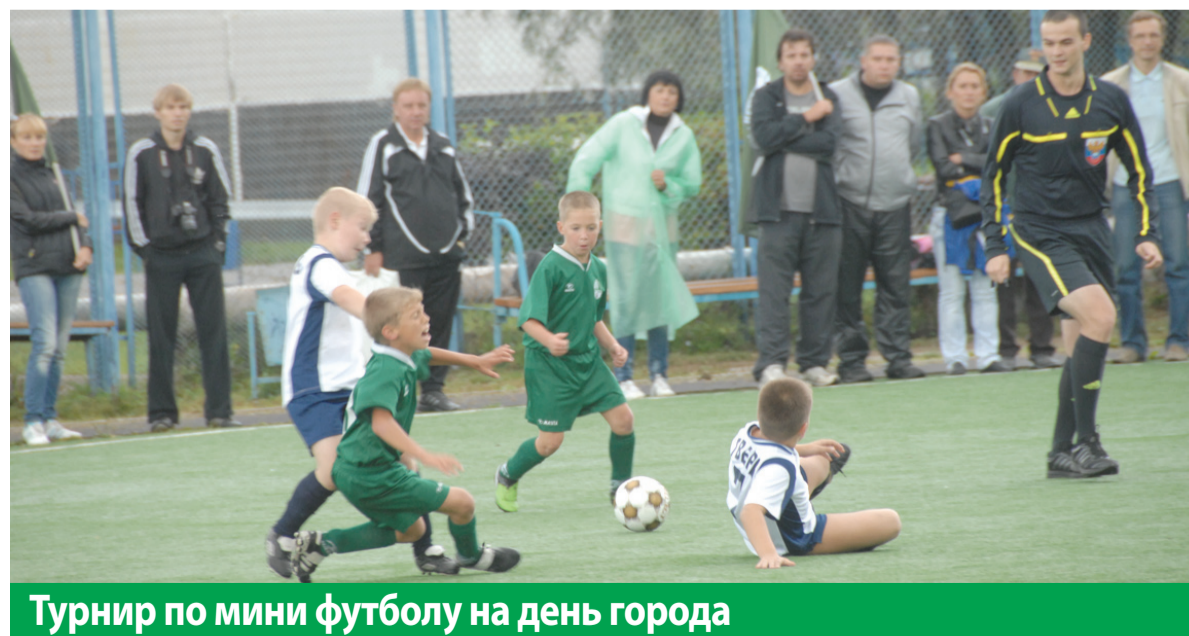
Турнир по мини футболу на день города

Респонденты могут выбрать одно из 5 спортивных состязаний: турниры по мини-футболу, стритболу, волейболу, шахматам и настольному теннису. Соревнования предполагается проводить в разных возрастных категориях.