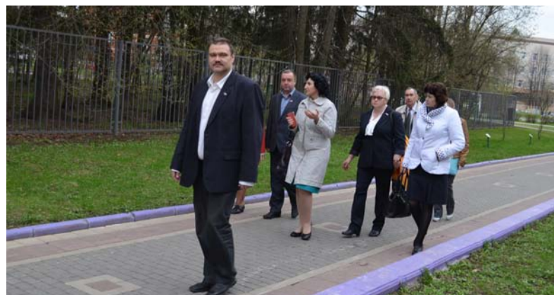
Прогулка по Сиреневой аллее