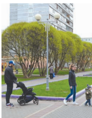
Троицк – друг и брат Зеленограда