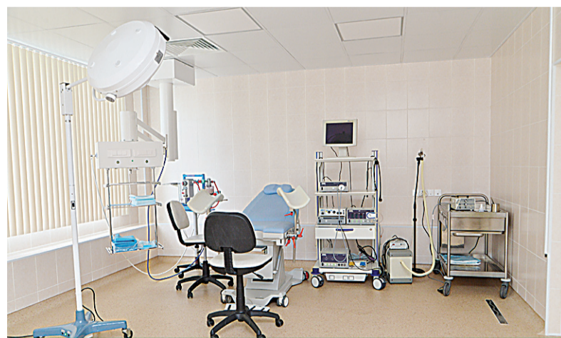
Новое отделение готово к работе

Новое отделение осуществляет все вышеперечисленные функции за исключением родовспоможения. Эту работу достойно выполняют наши коллеги в акушерских отделениях роддома.