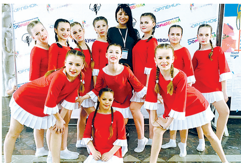
Юные дипломанты из «STAR KIDS»