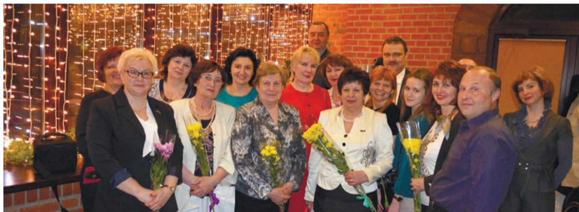
Гости из Зеленограда и их коллеги из Троицка

В городском округе Троицк (ТиНАО), с которым у Зеленограда налаживаются устойчивые деловые и культурные контакты, прошел праздник награждения наиболее активных общественных советников.