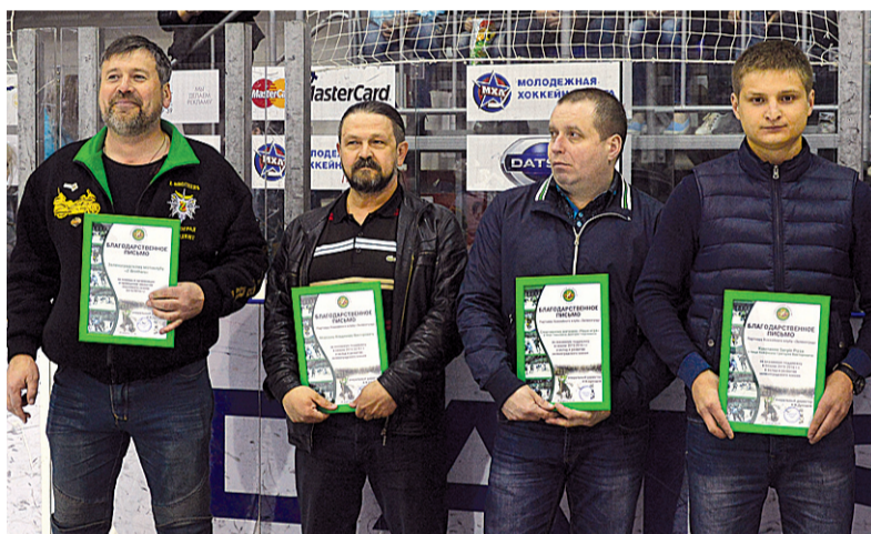
Спонсоры зеленоградского хоккея