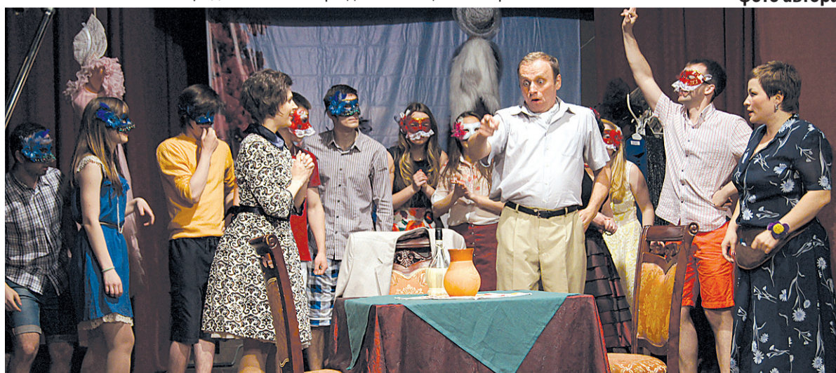
Театр-студия «Контакт» под руководством Т.СИЛИНОЙ