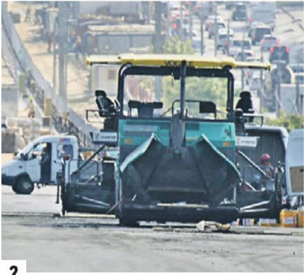
Сергей Собянин призывает москвичей прийти 14 сентября на выборы (1) 23 июля 2014 года. Завершается реконструкция развязки на Можайском шоссе (2) Мэр на открытии пешеходной зоны на Маросейке и Покровке (3)