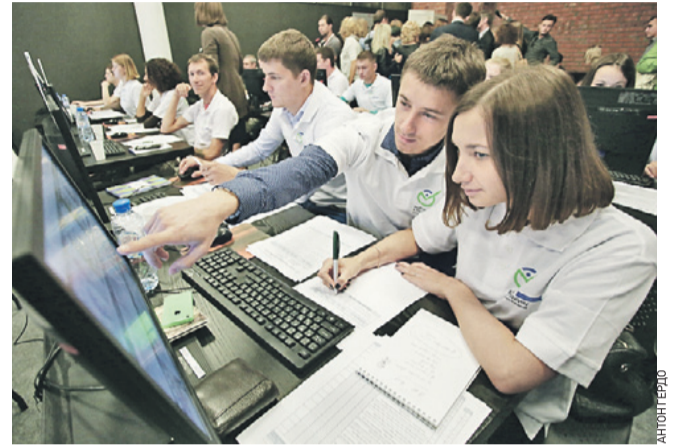
6 сентября 2014 года. 16.12 Демонстрация работы Общественного штаба наблюдателей за выборами