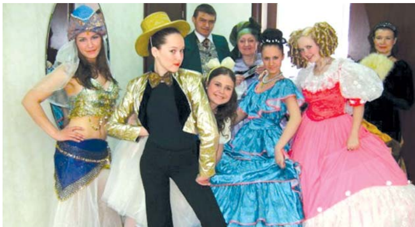
День открытых дверей в клубе «Силуэт»

26 августа в 17.00 в клубе «Радуга» (корп. 1013а) зеленоградцев ждут экскурсии по клубу, выставки декоративно-прикладного творчества, творческие мастер-классы, танцевальные флэшмобы. Участники Дня открытых дверей смогут познакомиться с руководителями объединений и их творчеством. На сцену выйдут вокальные и хореографические коллективы, которые будут работать в клубе с сентября.