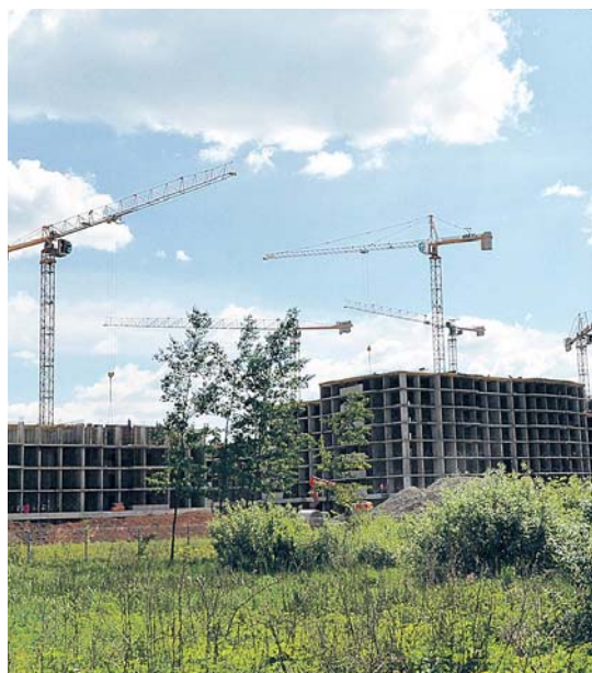
Новая практика – продажа квартир через электронные аукционы

« В ходе программы «расширили» узкие места в городе, избавились от пробок