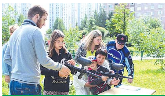
Соревнования по стрельбе