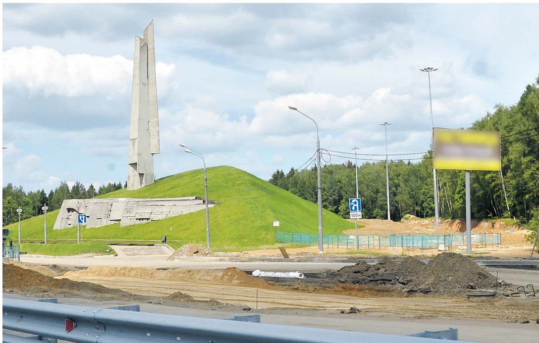
Работа по развязке Ленинградского шоссе у мемориала «Штыки»

Благодаря этому мы «расширили» узкие места в городе, избавились от пробок, которые, конечно, не шли в сравнение с московскими, но уже реально создавали сложности на дорогах. Кстати, не полностью, но все же в значительной