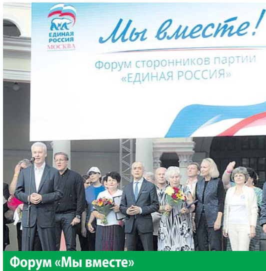
Форум «Мы вместе»

Про ЛДПР мы уже упоминали – они ведут свою агитацию ярко,