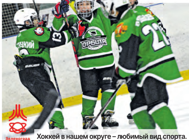
Хоккей в нашем округе – любимый вид спорта.

Особое внимание уделяется подготовке хоккеистов. Она проходит на базе спортшколы «Московская академия хоккея», «Зеленоград» и «Запад». Также москвичи могут посещать занятия в спорткомплексах «МосСпортОбъ-