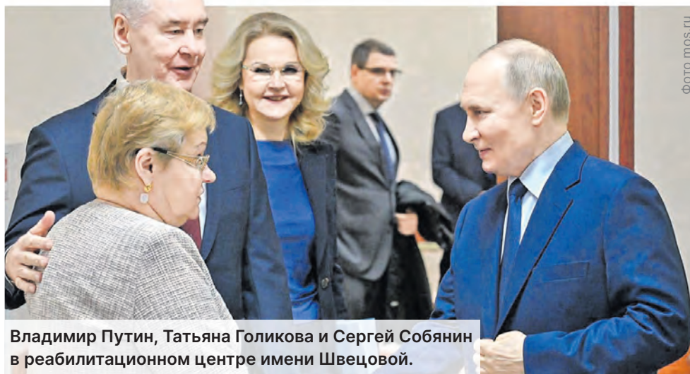
Владимир Путин, Татьяна Голикова и Сергей Собянин в реабилитационном центре имени Швецовой.

– Для каждого пациента разрабатывается индивидуальная программа. Специ-