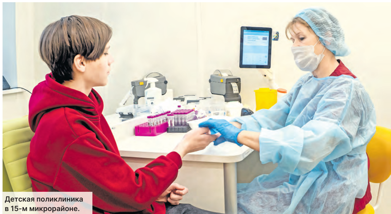
Детская поликлиника в 15-м микрорайоне.

Сотрудники возвращаются на свои рабочие места и начинают прием пациентов, для которых тоже привычнее ходить в свою поликлинику, ближе к дому. Но, конечно, после рекон-