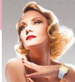
12 января 1967 года родилась Рената Литвинова – российская актриса театра и кино, кинорежиссер, сценарист, телеведущая, певица

В одиночестве скучать не будете. У вас море почитателей и ухажеров. Заниматься спортом – это залог здоровья.