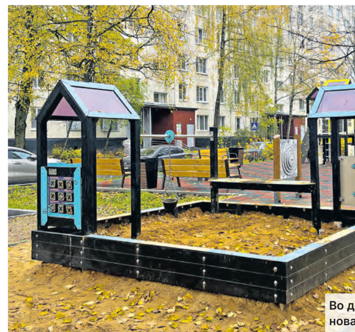
Во дворе новое