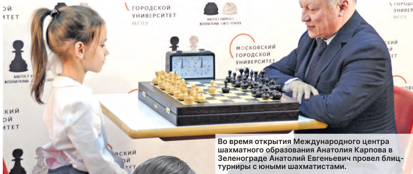
Во время открытия Международного центра шахматного образования Анатолия Карпова в Зеленограде Анатолий Евгеньевич провел блиц-турниры с юными шахматистами.

деньгами сбежали за рубеж. Обманутые вкладчики... Мы первые, кто в России решил эту проблему. Кроме того, мы побороли международную монополию, когда у нас в стране под влиянием западных компаний стали снижать цены на закупку молочной продукции. Это делало нерентабельным производство молока и по цепочке приводило к его удорожанию для покупателей. Мы – это пять депутатов от Тюменской области. Да, мы объединяемся для решения сложных проблем.