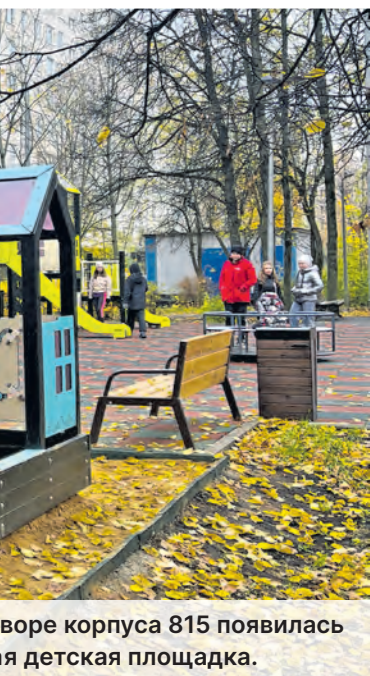
Во дворе корпуса 815 появилась детская площадка.

рая площадка была не такой удобной, не было много того, что есть сейчас. Сегодня двор выглядит более ухоженным. Здесь очень удобные качели-гамак. Спасибо городским службам, – рассказал Игорь.