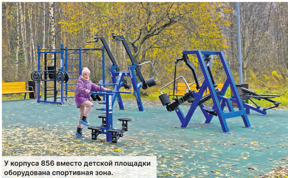
У корпуса 856 вместо детской площадки оборудована спортивная зона.

У корпусов 815 и 908 были установлены новые малые архитектурные формы и игровые комплексы: появились горки, качели, качели-балансир, карусель, песочница, меловая доска, воркаут, лавочки, урны.