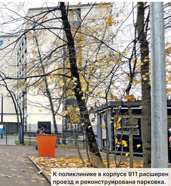
На Крюковской площади организована удобная пешеходная зона.

Новое асфальтовое покрытие общей площадью 4,6 тысячи кв. метров появилось на двух объектах: у корпуса 815 и у корпусов 834А/Б/В на Крюковской площади.