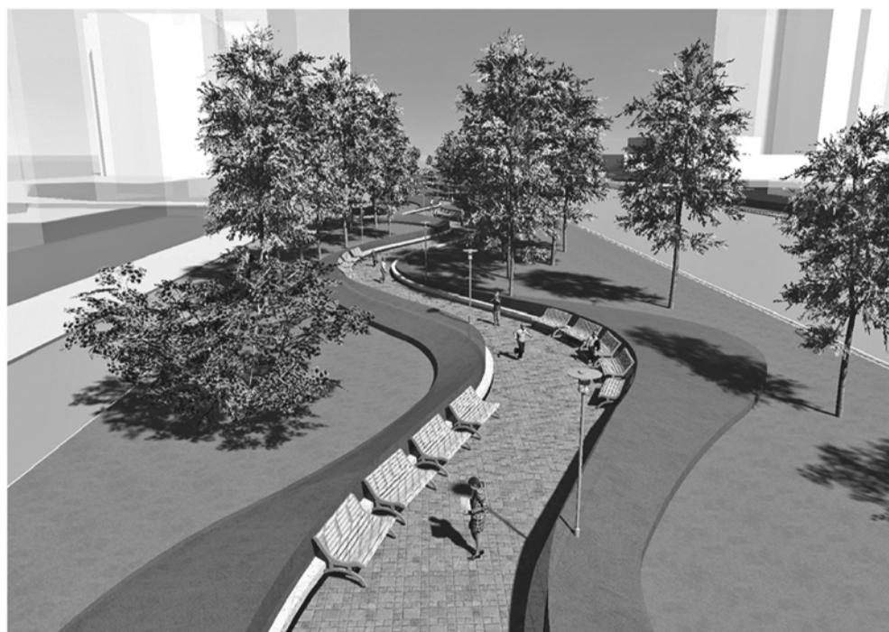
Фрагмент проекта аллеи, которая пройдет от Смоленской набережной до Садового кольца