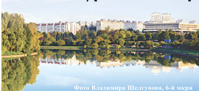
Фото Владимира Шелгунова, 6-й мкрн

В ЦКД «Зеленоград» проходит фотовыставка «Зеленоград глазами жителей». Выставку можно посетить с 15 ноября по 15 декабря. Выставка размещается на 2-м этаже фойе.