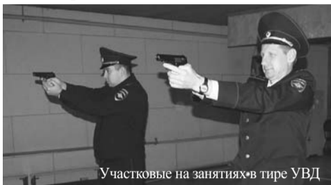
Участковые на занятиях в тире УВД