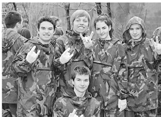
Ребята из Центра молодежного парламентаризма