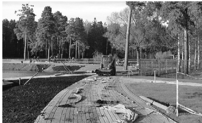
Парк в Нововедоровском поселении обустроят среди сосен

на период 2014–2016 годы. Природно-исторические, спортивные парки решено организовать практически в каждом поселении Новой Москвы. А в Щаповском поселении помимо спортивного должен появиться еще и археологический парк.