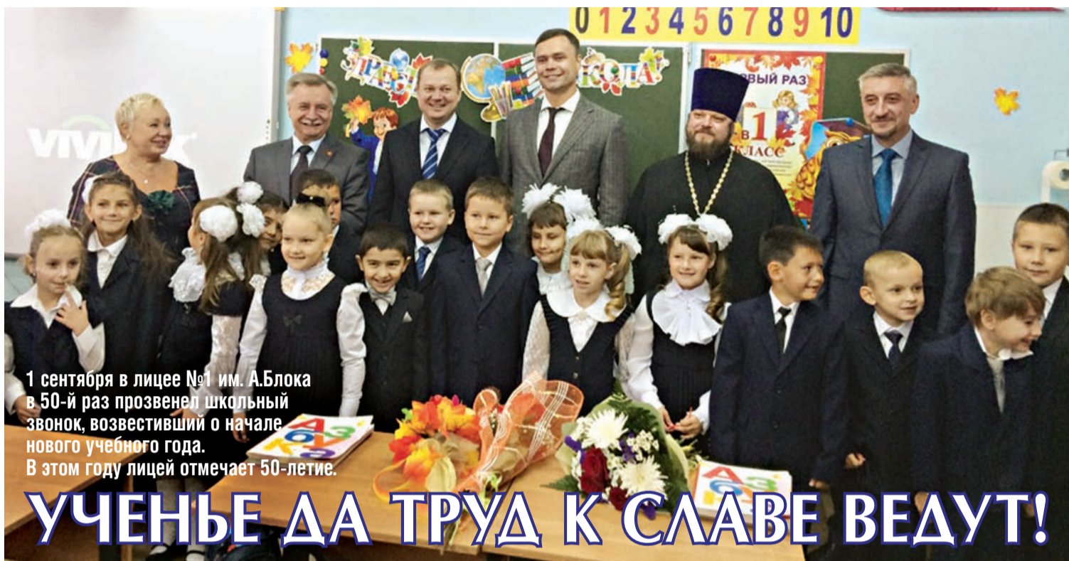
1 сентября в лицее №1 им. А.Блока в 50-й раз прозвенел школьный звонок, возвестивший о начале нового учебного года. В этом году лицей отмечает 50-летие.