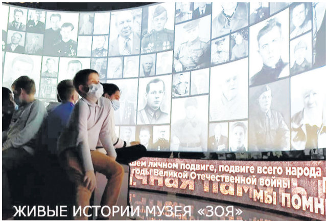
ЖИВЫЕ ИСТОРИИ МУЗЕЯ «ЗОЯ»

■ Ко Дню начала контрнаступления советских войск под Москвой - 5 декабря - в социальных сетях запускают акцию: жители городского округа Солнечногорск могут на своих страницах запостить истории о героях их семьи.