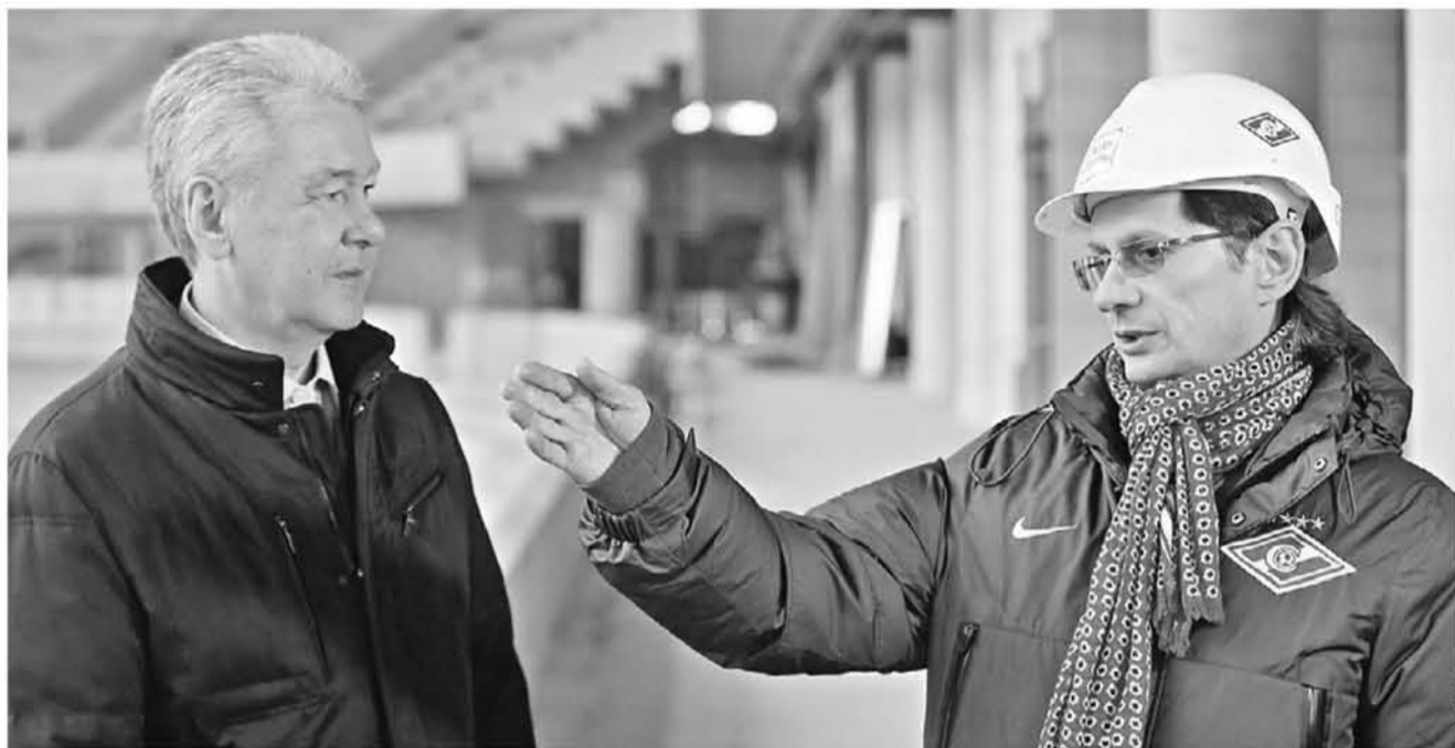
Вчера 10.55 Председатель совета директоров спортклуба «Спартак» Леонид Федун (справа) рассказывает мэру Москвы Сергею Собянину о том, что через три дня на стадионе завершатся работы по подготовке базы для формирования поля