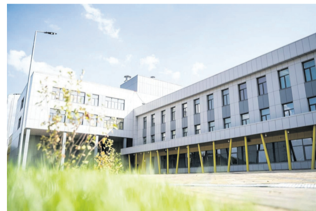
Современная школа в Рекинцо-2 готовится к открытию

В новом долгожданном образовательном учреждении помимо просторных светлых учебных классов предусмотрены специально оборудованные аудитории для обучения иностранным языкам, естественным наукам, лаборатории и мастерские, помещения для групп продленного дня. В школе обустроены актовый и спортивные залы, столовая с пищеблоком полного цикла, информационно-библиотечный центр с медиатекой. Общая площадь здания около 18 тыс. кв. м.