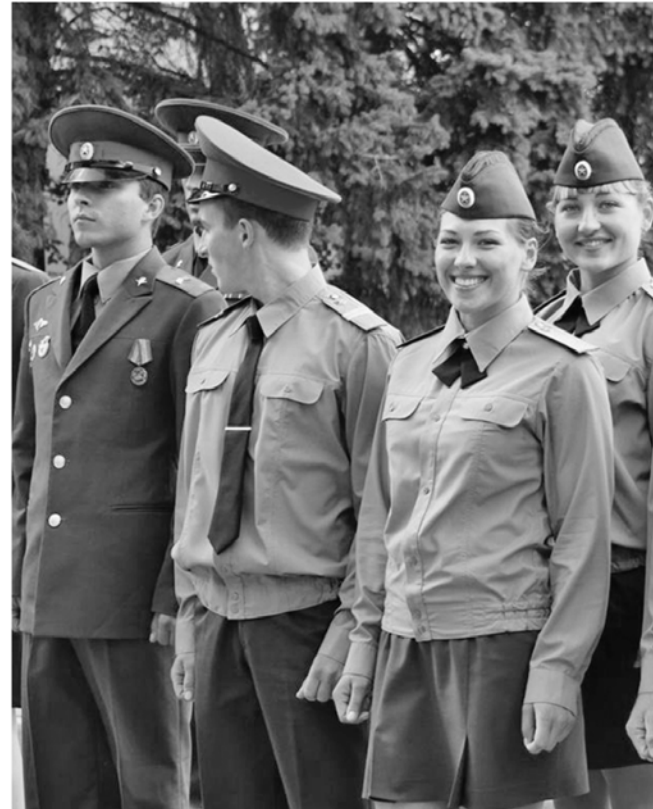
27 августа 16.15 Все конкурсанты настроены только на победу. Но добыть ее будет нелегко