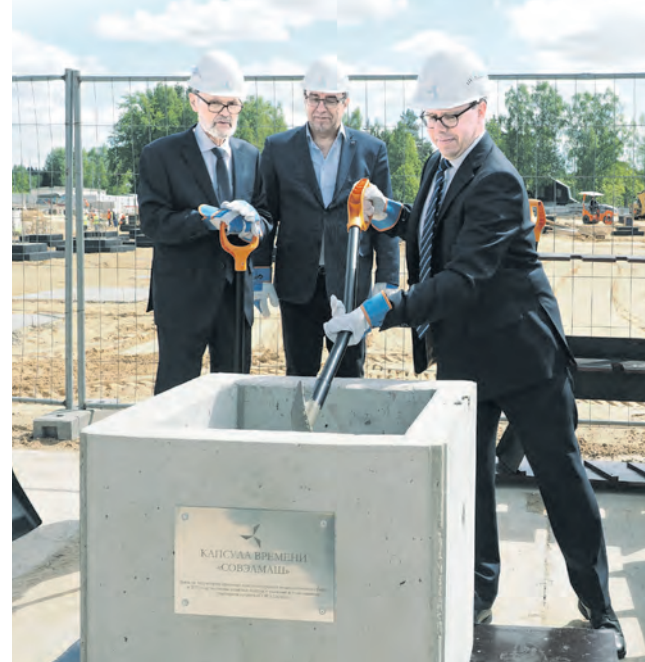
Закладка «капсулы времени»

Посол Финляндии отметил плодотворное сотрудничество финской и российской сторон на примере строительства данного объекта. Сегодня в России работают сотни финских компаний, традиционная деятельность которых – строительство промышленных объектов. Одна из них – Нака Москва, присутствующая на нашем рынке уже почти 35 лет