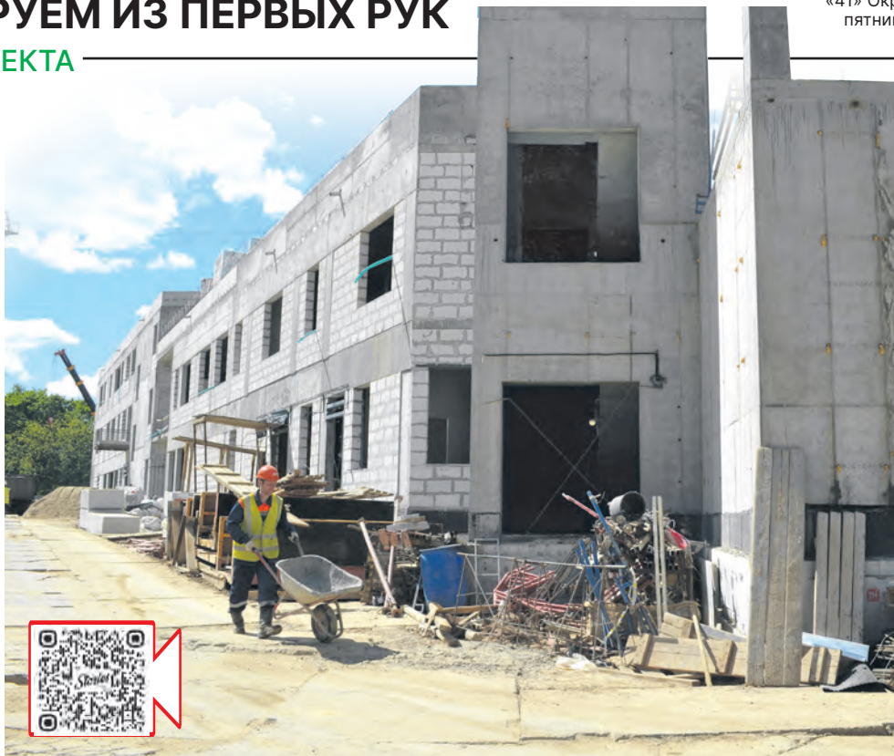
Новый спортивный комплекс скоро вступит в строй

Спортшкола – одна из самых мощных в Зеленограде, база подготовки молодых футболистов, многие из которых приходят играть в наш ФК «Зеленоград». В ней также готовят ребят по легкой атлетике, художественной гимнастике, другим дисциплинам. Но представьте себе, что у этой школы нет почти ничего! Только недавно им удалось передать стадион «Ангстрем» с небольшим по-