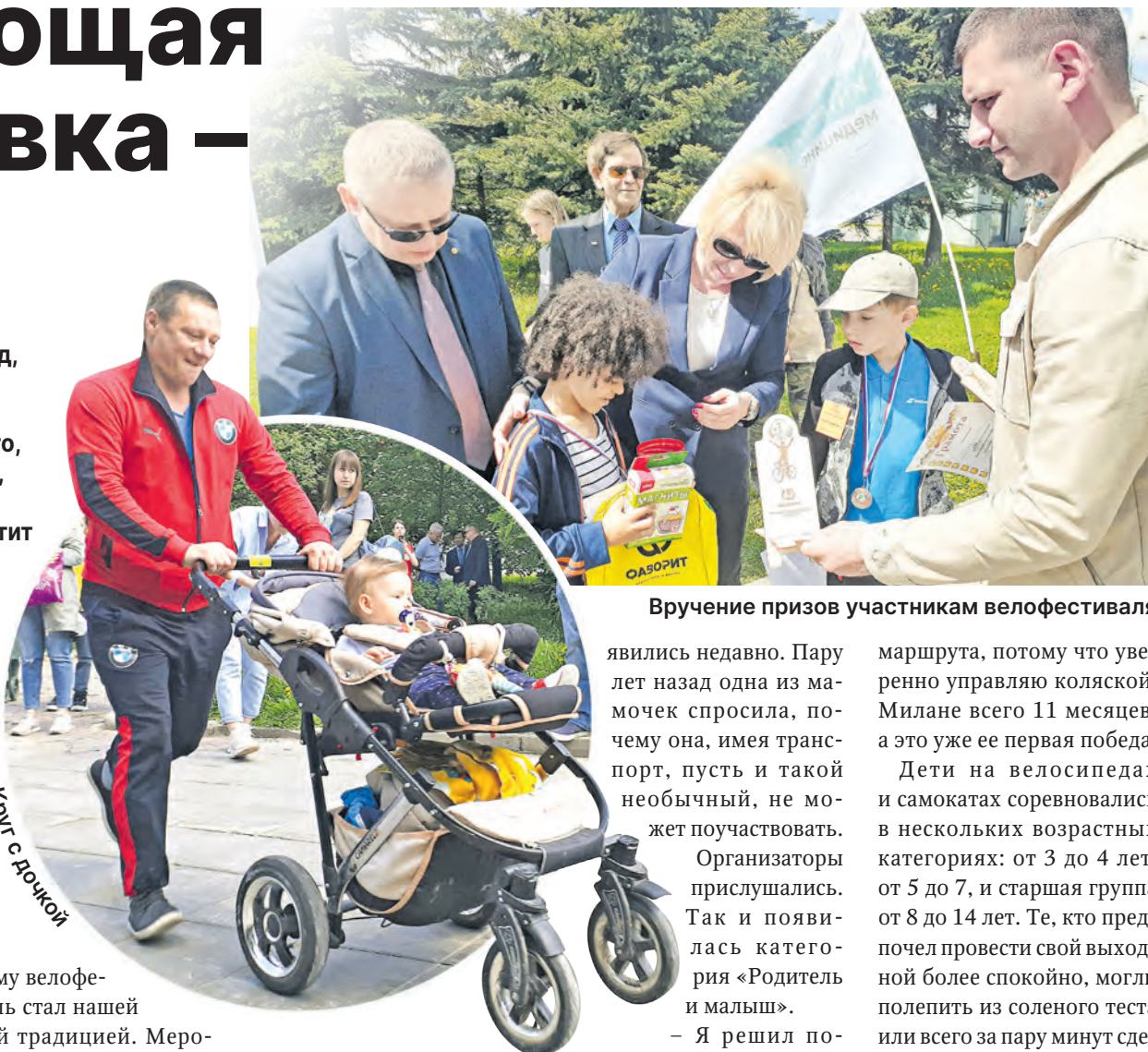
Вручение призов участникам велофестиваля

явились недавно. Пару лет назад одна из мамочек спросила, почему она, имея транспорт, пусть и такой необычный, не может поучаствовать.