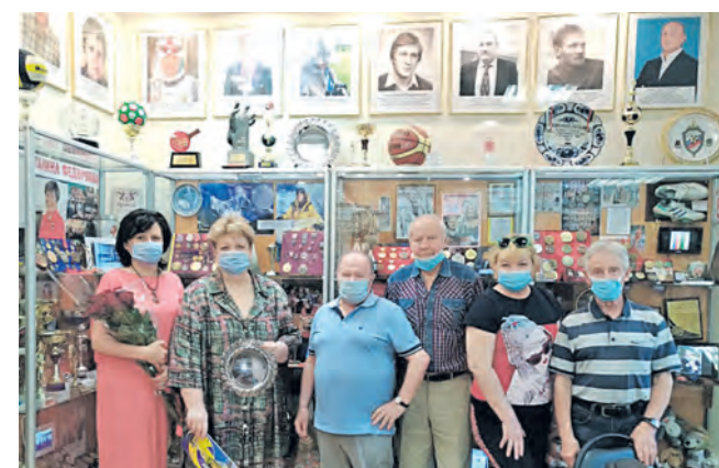
Делегация префектуры и газеты «41» в музее спорта Зеленограда

Также была подарена изданная в «41» карта Зеленограда, на которой участво-