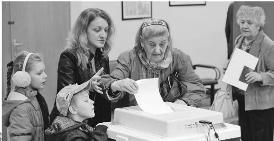
В день выборов мэра некоторые москвичи приходили на избирательные участки целыми семьями, чтобы проголосовать за будущее столицы