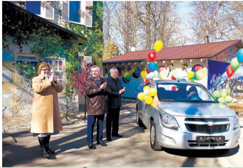
Торжественное вручение ключей от нового автомобиля