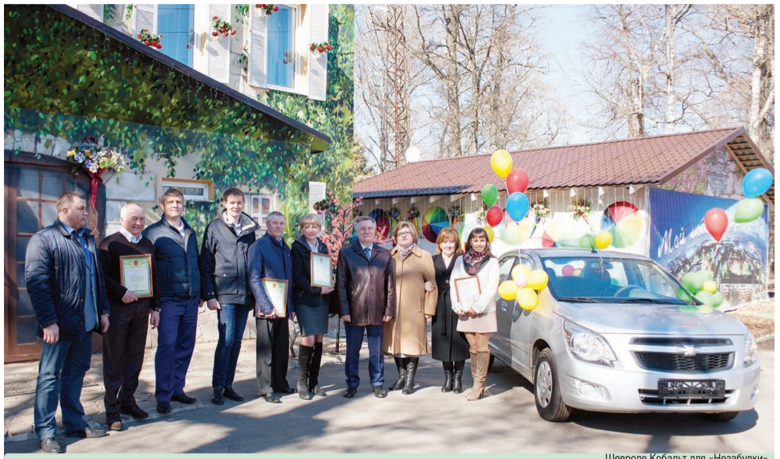
Шевроле Кобальт для «Незабудки»

Союз «Промышленники и предприниматели Солнечногорского района» и Благотворительный фонд социальных инициатив «Солнечногорье» вручили автомобиль Реабилитационному центру «Незабудка».