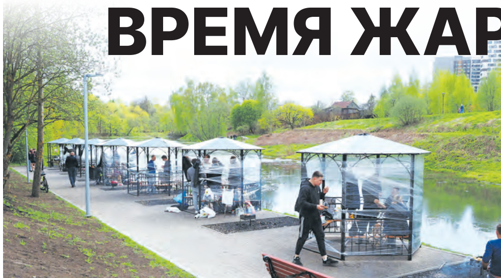
В выходной у Нижнекаменского пруда непросто найти свободную беседку

■ Зеленоградцам не нужно выбирать за черту города, чтобы устроить семейный ужин с барбекю на природе. Наш округ славится просторными лесопарками и живописными местами, обустроенными комфортными пикниковыми зонами.