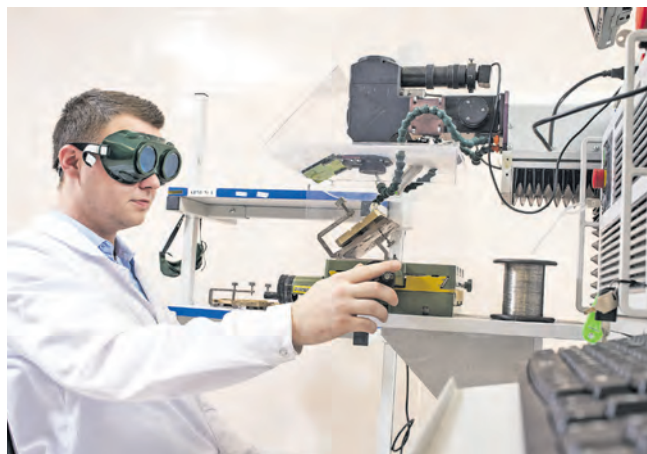
Радиомонтажник занимается разваркой кристаллов