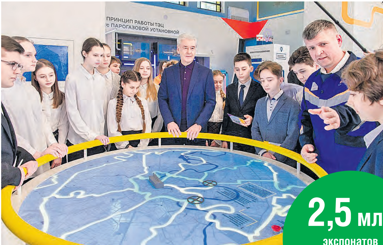
Сергей Собянин: Музеи Москвы востребованы у горожан и гостей столицы

Сергей Собянин) ждут интересные истории об управлении городом, уникальными системами водо- и электроснабжения.