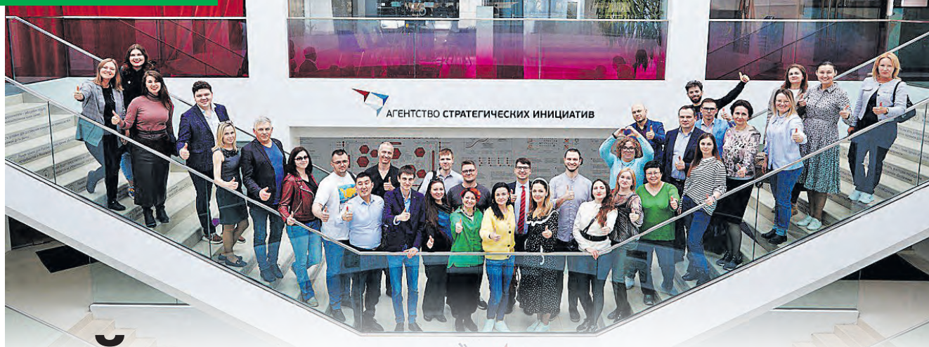
На форсайт-сессию съехались лидеры ТК со всей страны