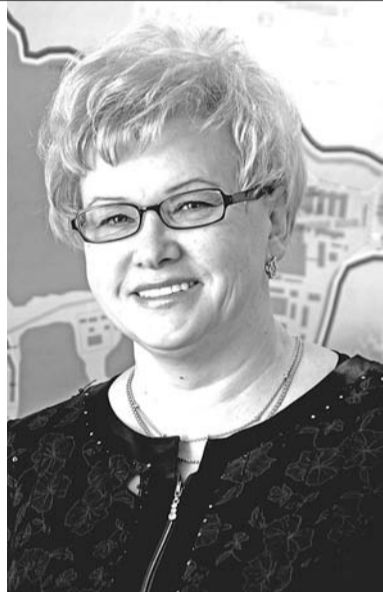
Мэром Москвы были выделены дополнительные средства из городского бюджета для проведения названных работ.