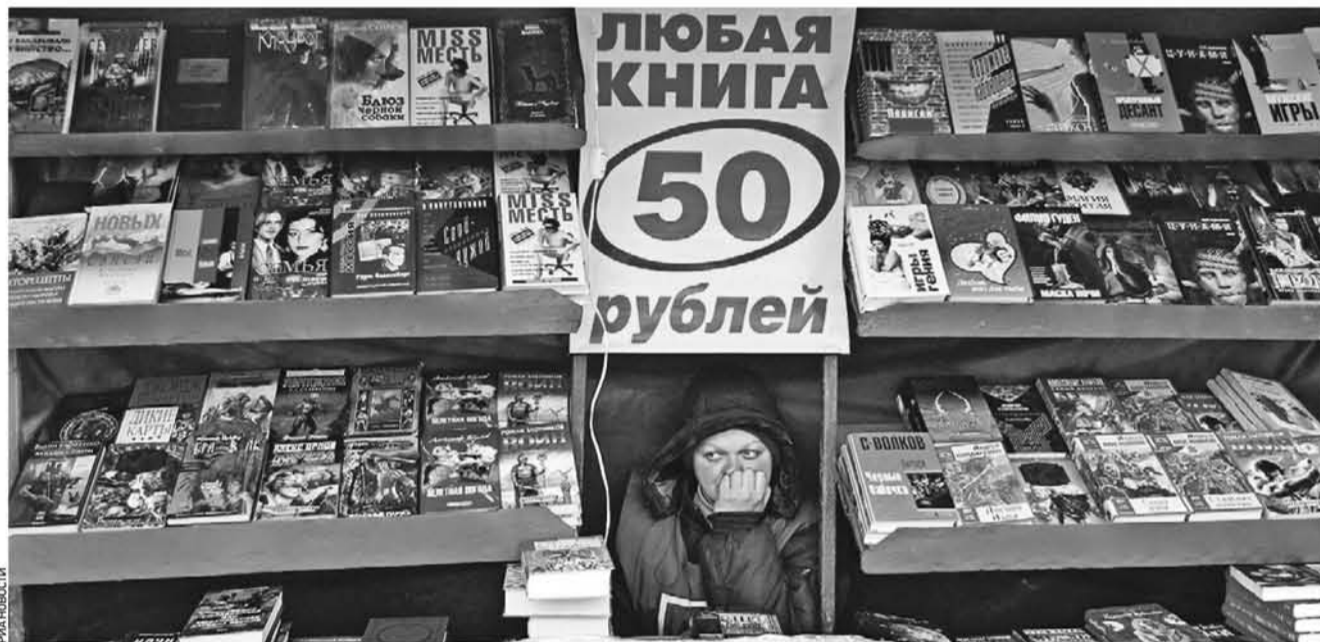
По новым правилам розничная торговля в аптеках, палатках и на рынках становится доступной только для граждан РФ

— В городе много объектов для отдыха зимой, — отметил Сергей Собянин (на фото). — Создано 239 лыжных трасс, 1380 катков с естественным льдом и 180 — с искусственным. Заммэра по вопросам ЖКХ и благоустройства Петр Бирюков сообщил, что количество горожан, посещающих объекты зимнего отдыха, увеличилось. Так, если в прошлом году их посетило 21 миллион человек, то, по предварительным данным, в текущем году число посетителей составит 26 миллионов. Также он пояснил, что лыжных трасс по сравнению с прошлым