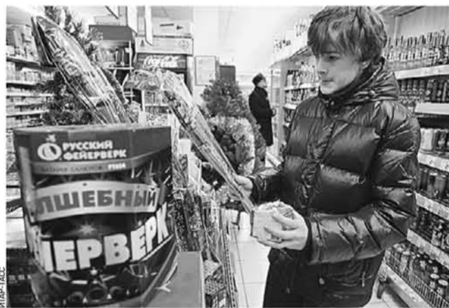
Прежде чем запускать пиротехнику, ее нужно выбрать

В ТиНАО впервые определены места для запуска фейерверков в новогоднюю ночь. Раньше таких площадок здесь не было: в ТиНАО много частных домов и открытых пространств, запретить людям запускать фейерверки у себя во дворах было нелегко. Между тем столичные нормы есть — запустить новогодние шутки и в Новой Москве теперь должны, не нарушая принятых в Москве стандартов. Основные критерии, которым такие площадки должны соответствовать: удаленность от линий электропередач, жилых домов