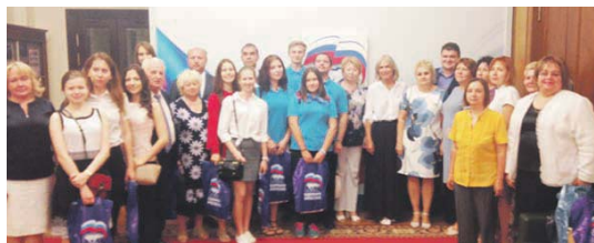
Зеленоградцы в Госдуме

– Очень важно, что вы помогаете с организацией досуга пожилых людей, но вот на что хотелось бы обратить внимание. Сегодня пен-