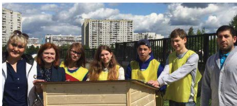
Зеленоградские пернатые получили новую жилплощадь