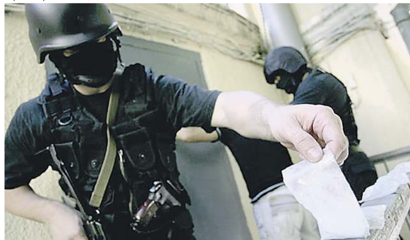
За пять месяцев 2016 года в столице пресечена деятельность 123 наркопритонов

столицы проводится эксперимент по внедрению сертификата на предоставление услуг по социальной реабилитации и ресоциализации граждан, страдающих наркологическими заболеваниями. Функции оператора возложены на Департамент труда и социальной защиты населения. За два