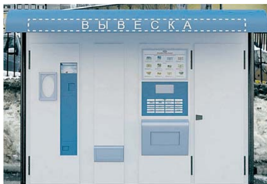
Такие автоматы появятся в 3 и 6-м мкр

Торговый автомат «Молоко» будет предназначен только для автоматизированной продажи молока и упакованных молочных продуктов. Внешне он будет выглядеть как киоск с крышей. В нем будут предусмотрены отсеки для продажи разливного