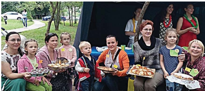
Всего хозяйки приготовили 10 блюд: пироги, кексы, блины