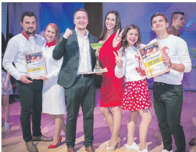
Команда-победитель КВН «Будем дружить семьями»

зрительный зал. А в завершение вечера для зрителей были разыграны спонсорские призы.