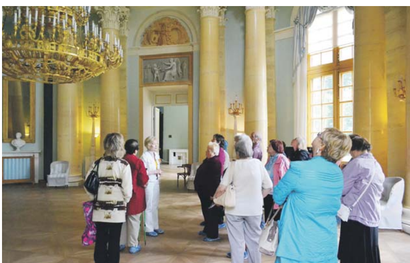
Программа «Московское лето. 55+» в усадьбе Коломенское

Программа «Московское лето. 55+» – естественное продолжение