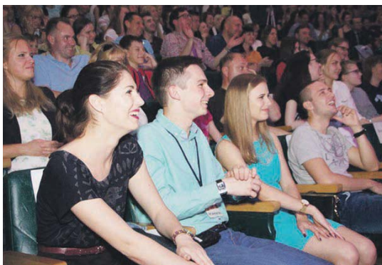
Зрители в восторге!