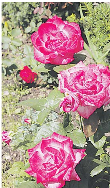
ГРАФИК ПРОВЕДЕНИЯ КОНКУРСА «ЦВЕТОЧНАЯ СИМФОНИЯ» 29 ИЮНЯ 2016 г.