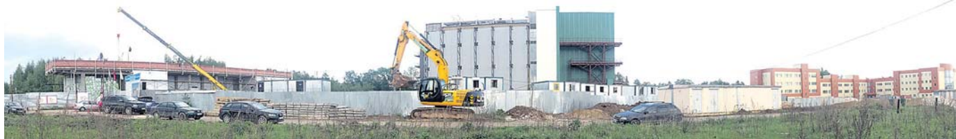
Строящиеся здания резидентов ОЭЗ «Зеленоград»