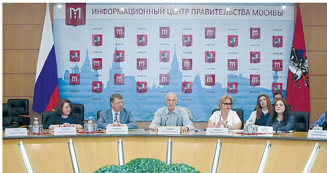
Пресс-конференция о XXIV Международном детском кинофестивале «Алые паруса»

В информационном центре Правительства Москвы состоялась пресс-конференция, посвященная XXIV Международному детскому кинофестивалю «Алые паруса «Артека».