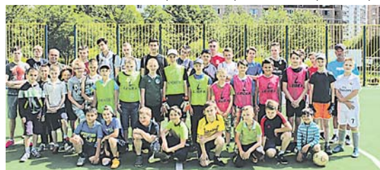
Соревнования по мини-футболу

Традиционными стали и спортивно-досуговые мероприятия, проводимые центром «Фаворит» совместно с общественной организацией «Средневековый город» – во дворах района для младших детей организуются спортивные и развлекательные конкурсы, викторины и др. Ребята знают, по каким дням к ним во двор придут организаторы маленького праздника и с нетерпением ждут их. Один раз в неделю организаторы