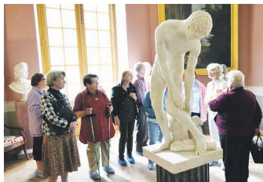
Гости музея-усадьбы за несколько часов узнали массу интересного

подмосковный воздух, невероятная атмосфера Архангельского – посетившие экскурсию москвичи остались довольны.