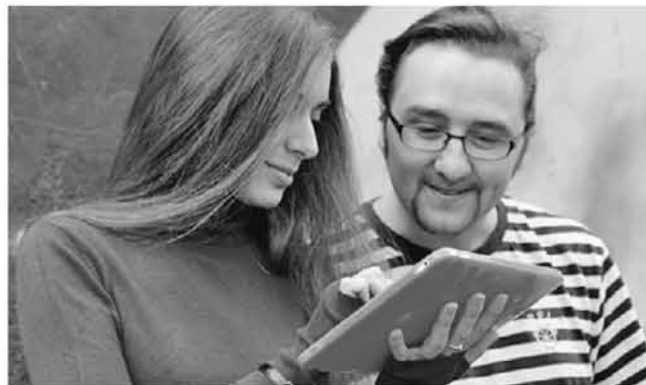
Правительству Москвы будет рекомендоваться новый сервис

мобиль- жений, на тепло- » была менным асти ком- зованию ожений ских про-