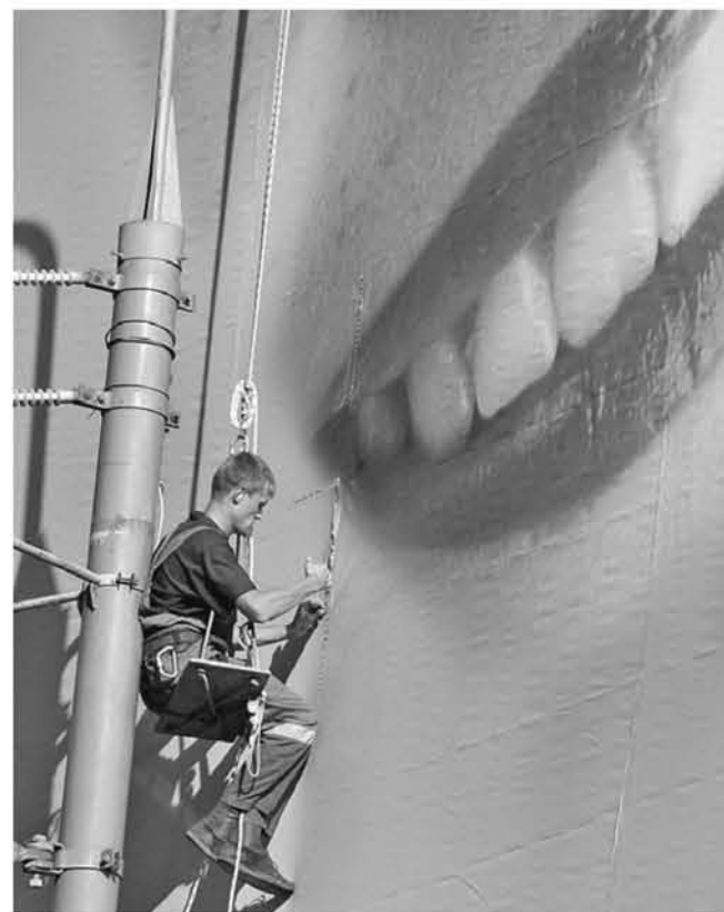
Город избавится от крупноформатной рекламы на крышах. Она исчезнет, как в свое время пропали перетяжки над дорогами

Зам мите разовани рассказал поправки товили к з вании. В к обсудят на совещани закон вст — За зако большин Но мы под поправок дем их пр яснил Оле По его сло новаций с новная — положени ские сады превышат затрат на Также деп за введен сти в сдач — Я знаю Мосгорду о том, что школьни в неравно счет слиш конкurre ность ЕГЭ блему, — тарий. Третья по лена прот числа бюд — По нов должно у к 2020 год будет 800 подчерки Мы предл количест до 220 на ния, как б