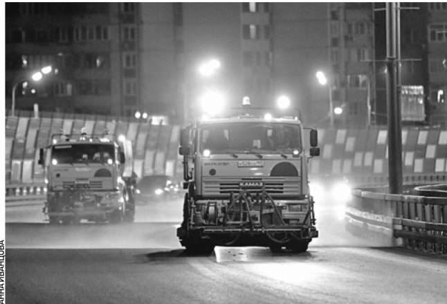
28 сентября 02.47 Живописный мост — в числе первых, обработанных противогололедным реагентом