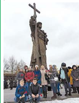
Активисты зеленоградского клуба «Вектор» на открытии памятника князю Владимиру

День народного единства отмечается в России ежегодно 4 ноября. Он приурочен к освобождению русских земель от польских интервентов и подвигу легендарных нижегородского посадского старосты Кузьмы Минина и князя Дмитрия Пожарского в 1612 г., символизирует единство и сплоченность народов.