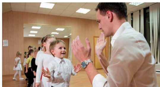
В планах – взрослая группа для занятий