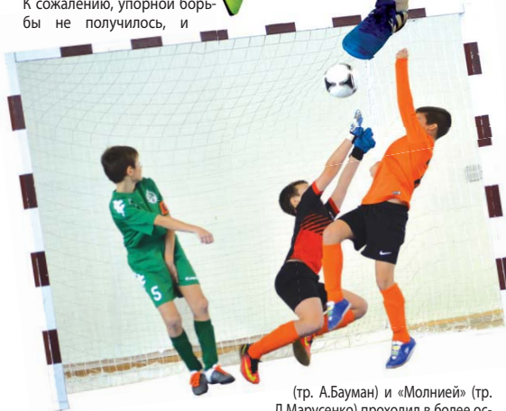
наши девятилетние футболисты проиграли – 0:5. Второй полуфинал между ЦСКА