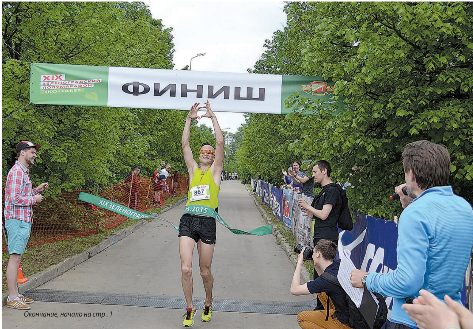
Окончание, начало на стр. 1

– Это, конечно, не главная составляющая, основной мотив все-таки остается спортивный. Но тем не менее некоторый экологический уклон мы придали нынешнему забегу. У нас организован отдельный сбор мусора, продажа экологических продуктов, проводится эколекторий для детей. Даже стаканчики для питья на пунктах питания спортсменов – не пластиковые, а из особого быстро распадающегося органического материала.