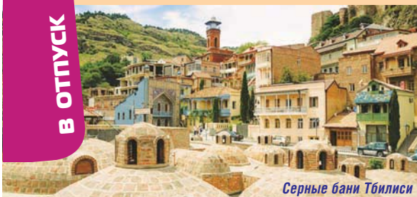
Серные бани Тбилиси

Грузия, хорошо знакомое нам государство со столицей Тбилиси , расположилось в Закавказье, на территории от восточного берега Черного моря до большого Кавказского хребта. За последние годы, благодаря долгосрочной программе развития туристической индустрии в эконо-