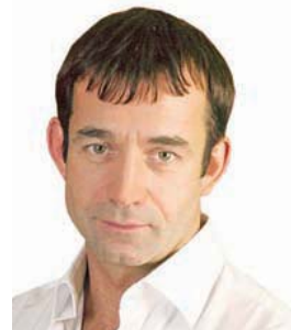
8 июля 1963 г. родился Дмитрий Певцов - российский актер театра и кино, певец, народный артист России

Наступает время отдыха, спокойствия, здорового сна и долгих прогулок. В доме все будет хорошо и мирно, семья будет ценить вас за вклад в отношения.