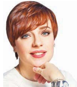
5 июля 1974 г. родилась Тутта Ларсен - известная телеведущая