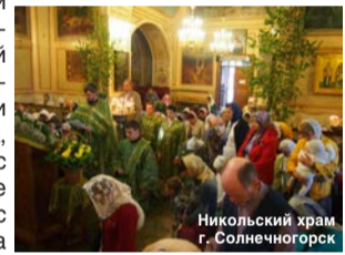
Никольский храм г. Солнечногорск

общецерковная акция. Во время службы на сороке были установлены подсвечники на поминовение убиенных младенцев, а после Божественной Литургии была вознесена молитва с обращением к Святой Троице о просвещении нашего народа.