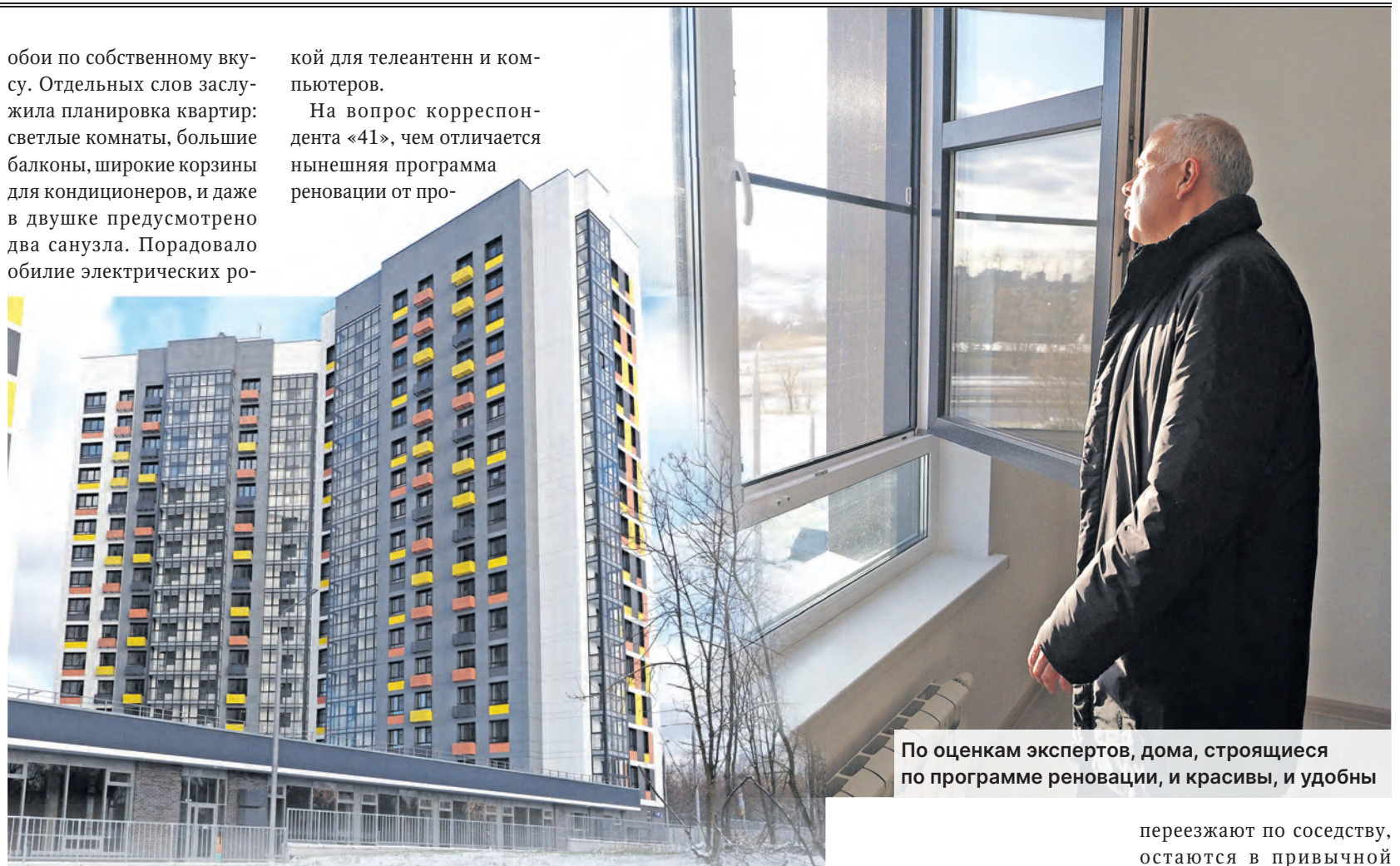
По оценкам экспертов, дома, строящиеся по программе реновации, и красивы, и удобны

На вопрос корреспон- дента «41», чем отличается нынешняя программа реновации от про-