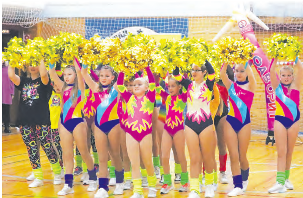
Свое мастерство показывает группа «Аэробика» ГБУ «Фаворит»