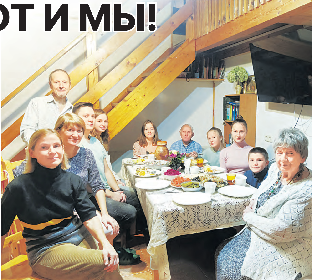
Большая семья – все в сборе!