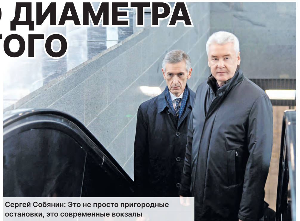
Сергей Собянин: Это не просто пригородные остановки, это современные вокзалы

На Киевском направлении Московской железной дороги открылся еще один современный пригородный вокзал, который уже в конце 2023 года станет частью линии наземного метро. Реконструкция заняла чуть больше двух лет. Во время ремонта станция продолжала работать – для пассажиров были сооружены временные платформы.