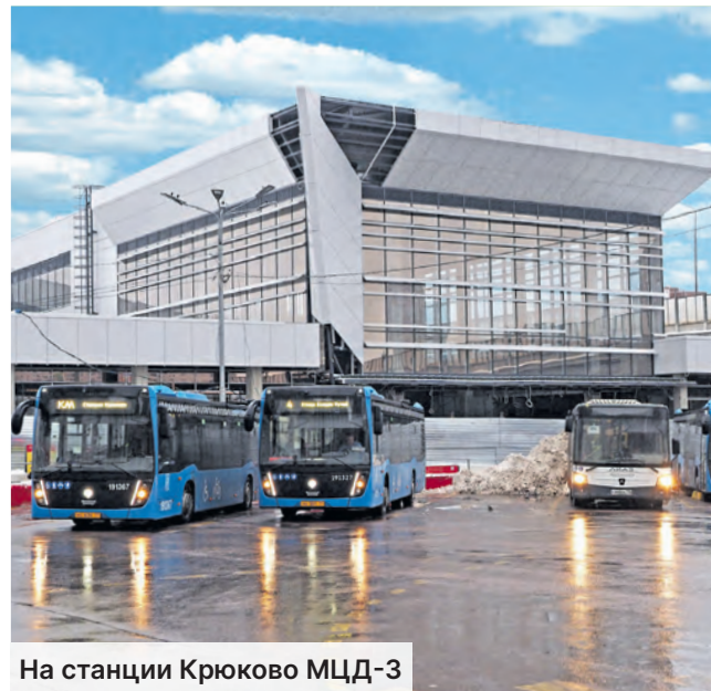
На станции Крюково МЦД-3