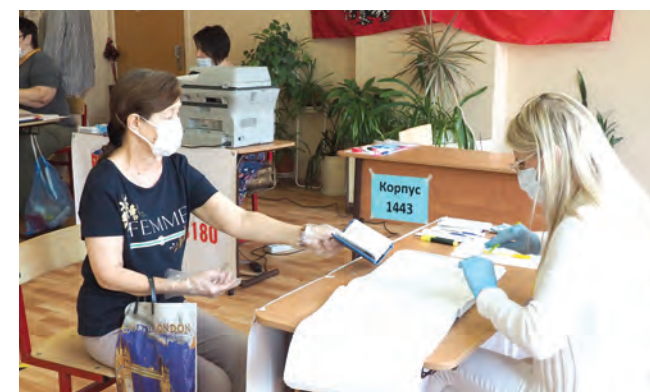
Члены участковых комиссий и голосующие в масках

Высокую оценку процедуре проведения электронного голосования дали и между-