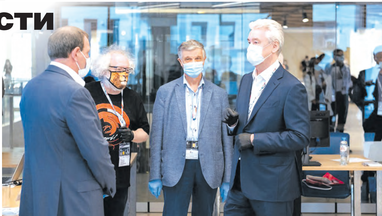
Сергей Собянин посетил штаб по контролю и наблюдению за голосованием по поправкам в Конституцию РФ

– Есть наблюдатели, люди приходят. С точки зрения технологии, процесс тоже на высшем уровне и соответствует всем принципам, которые приняты в международных отношениях, – подчеркнул эксперт.