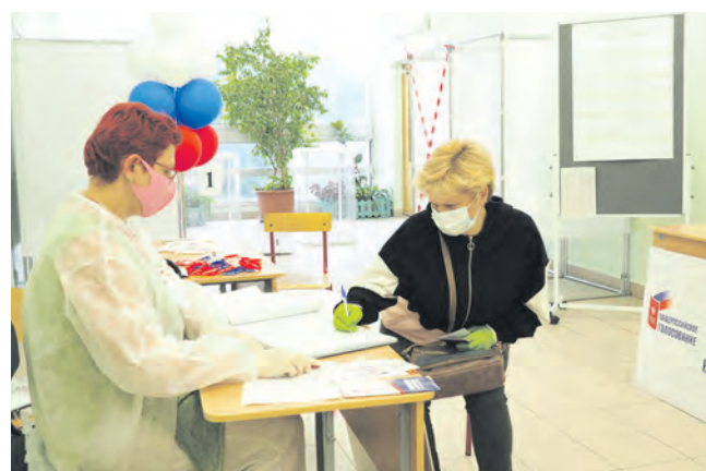
Голосование в школе №853

нять участие в голосовании, не отрываясь от работы. На мой взгляд, это весьма удобно для людей, которые работают посменно, далеко от дома, – добавила она.