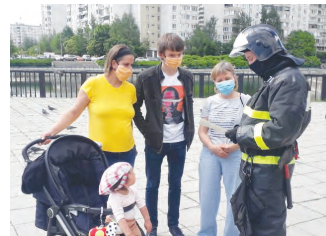
Дети внимательно слушают пожарного