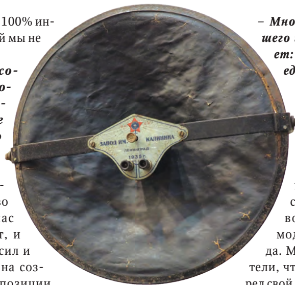
Радиотарелка (репродуктор) времен Великой Отечественной войны в тематическом зале «Там, где погиб Неизвестный Солдат»

– Известно, что мы собираемся переехать во «Флейту». Сейчас там идет ремонт, и мы очень много сил и времени тратим на создание новой экспозиции, на адаптацию под музейно-выставочное освоение новых помещений. Но здесь – на улице Гоголя – мы работаем в прежнем режиме. 1 августа готовимся представить выставку эскизов Серафима Павловского – автора мозаичного панно чаши фонтана, расположенного на площади Юности, которая в 2017 году ушла в историю.