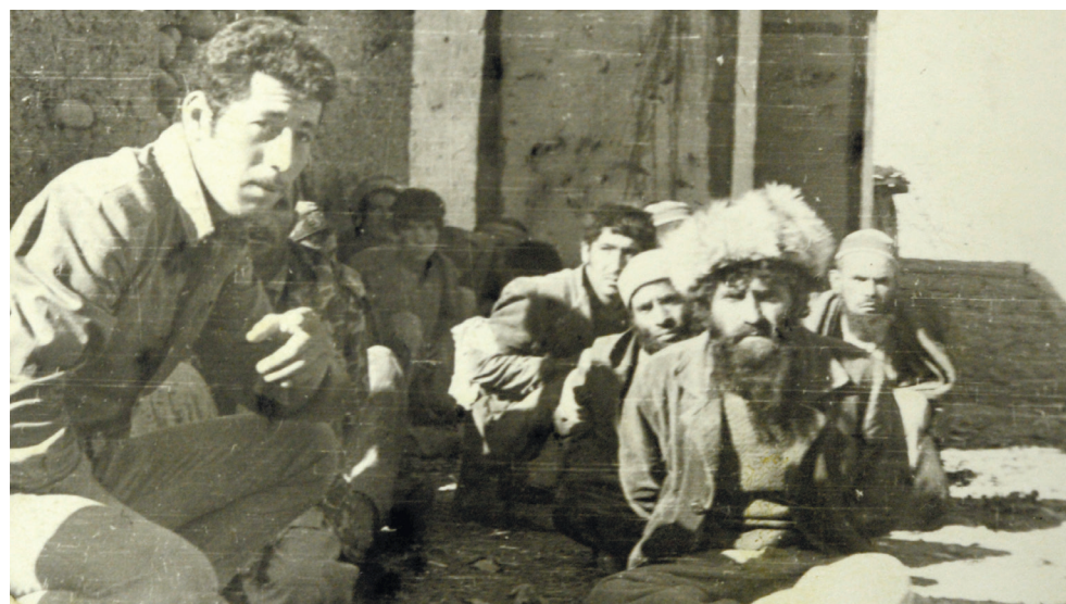
Разведчики взяли в плен басмача