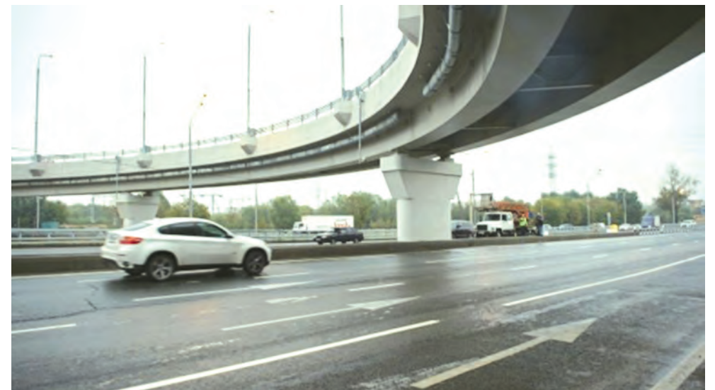
Более 160 миллиардов рублей вложено в развитие дорожной сети Новой Москвы

– Более 100 миллиардов рублей на текущий момент вложено в развитие метро в ТиНАО. Запланировано строительство Коммунарской линии метро до