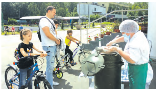
У школы №618 полевая кухня предлагала гречку с мясом

– Мы с женой сколько раз ходили голосовать сюда, в МГПУ – организация здесь всегда на высшем уровне. И сейчас, когда к требованиям безопасности в связи с пандемией добавились новые, ничего не изменилось: все так же, как и прежде – поделовому, без суеты. На входе измерили температуру, выдали маски и перчатки, четко соблюдается дистанция – и никаких проблем. Проголосовали как обычно.