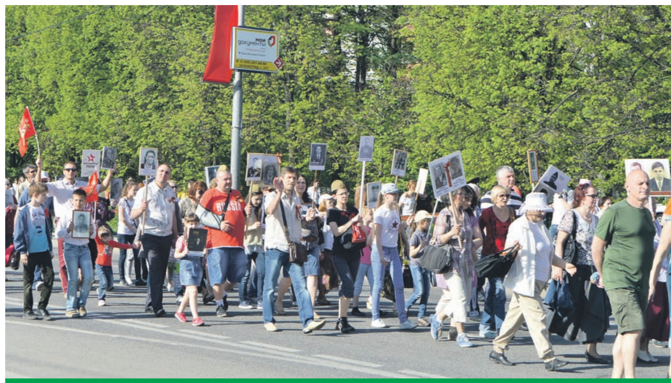
«Бессмертный полк» прошел в Зеленограде

Шествие кадетов состоялось, это действительно был парад. Но перед кадетами шли люди, по своей воле выстроившиеся в колонну. Мамы, папы и дети, деды и внуки несли таблички с фотографиями и именами воевавших отцов, дедов, прадедов. На сотни метров вдоль их шествия сотни молодых людей протянули гвардейскую ленту – сим-