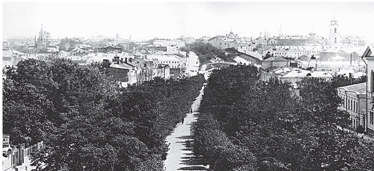
Вид на Петровский бульвар. Автор неизвестен. Съемка 1888 г.