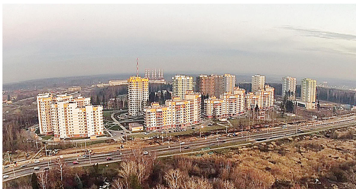
23-й микрорайон с высоты птичьего полета

Для того чтобы округ был самодостаточным, развивался действительно гармонично, необходимо создавать новые учебные и рабочие места, обеспечивать людям возможность учиться и работать