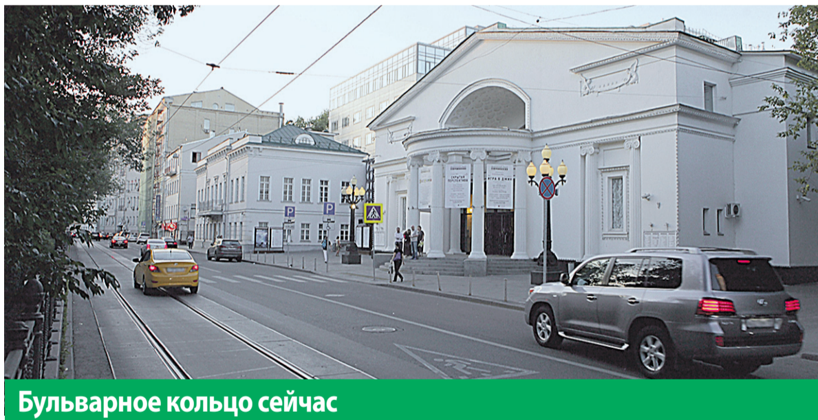
Бульварное кольцо сейчас

Работы по программе «Моя улица» полностью завершатся в октябре