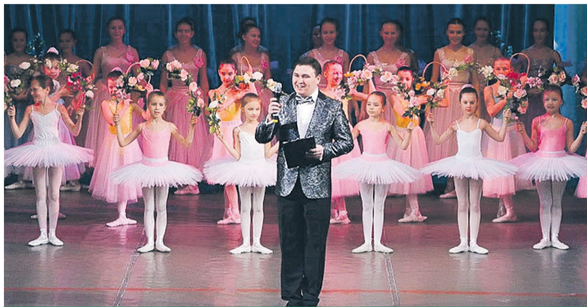
Участники отчетного итогового концерта-презентации

В КЦ «Зеленоград» состоится итоговый концерт-презентация творческих коллективов «Все грани нашего таланта».