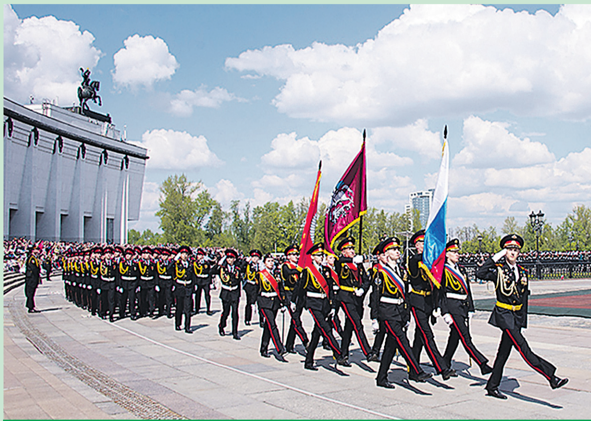
II Московский парад кадетов «Не прервется связь поколений!»

Мэр Москвы С.Собянин и патриарх Московский и всея Руси Кирилл приняли участие в параде учеников кадетских классов «Не прервется связь поколений» на Поклонной горе.