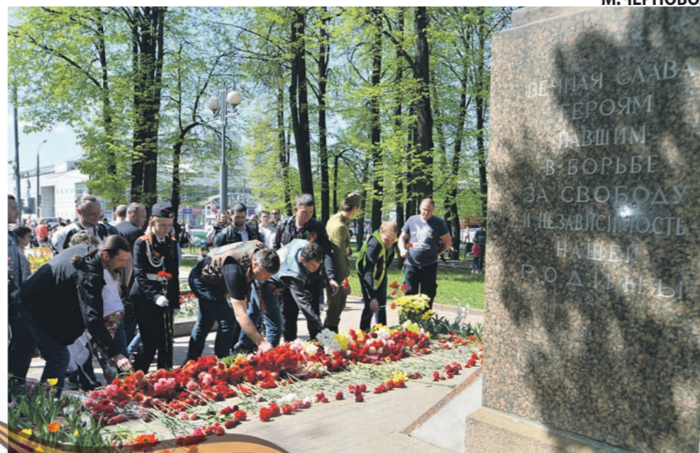
■ Е.С., фото А.Е., М.ЧЕРНОВОЛА

Молодые активисты помогли героям войны подняться на автомобили, после чего ветераны в составе автоколонны проехали по маршруту улица Каменка – Панфиловский проспект – Советская улица – Новокрюковская улица, где их приветствовали собравшиеся школьники и жители, которые держали в руках огромную Георгиевскую ленту.