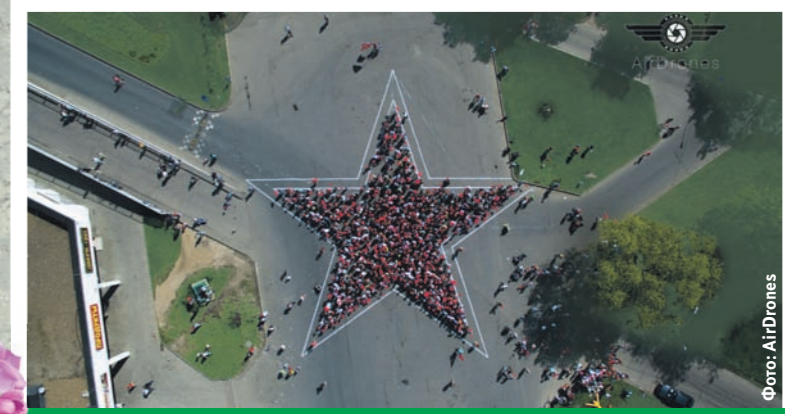
Народная звезда для военных летчиков