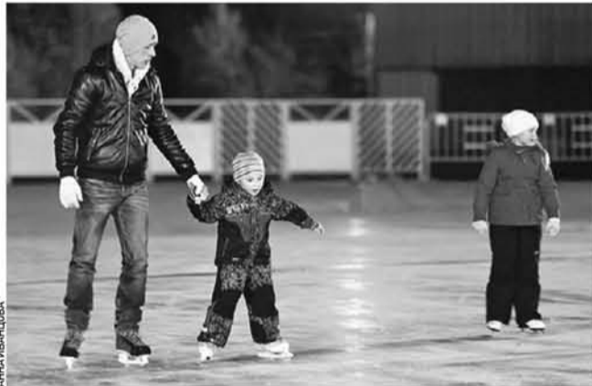
Новым москвичам пока доступны катки с натуральным льдом

Как только установилась минусовая температура, в ТиНАО начали заливать катки. Сейчас работает уже большая часть из запланированных. Всего на территории новых округов будет 25 катков (ни одного с искусственным покрытием), большинство находится во дворах, несколько — на территории школ и два — в парках. Катки самые разные — от совсем небольших (200 квадратных метров) при школах до катков так называемого олимпийского стандарта — 30 на 60 метров. В Московском, поми-