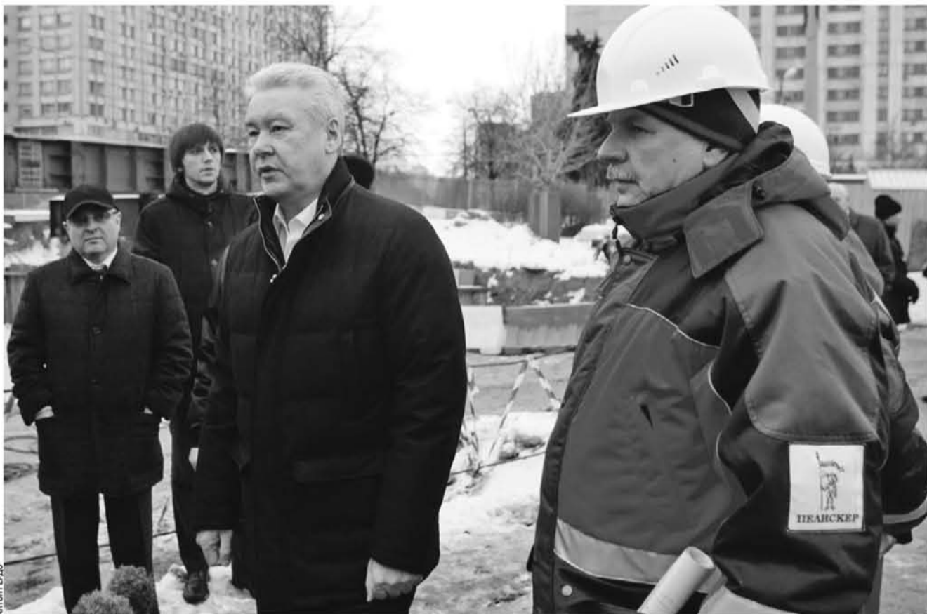
16 декабря 10.59 Мэр Москвы Сергей Собянин (в центре) выслушал доклад строителей о ходе работ по реконструкции Октябрьского тоннеля