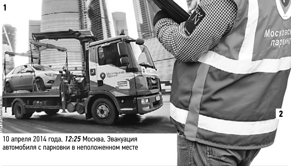
10 апреля 2014 года. 12:25 Москва. Эвакуация автомобиля с парковки в неполюженном месте

На встрече москвичи могут задать все интересующие вопросы напрямую руководству управы района. — Это отличная возможность для общения жителей и местных властей, — отметили в столичном Департаменте территориальных органов исполнительной власти. Кстати, заранее записываться на встречу не нужно.