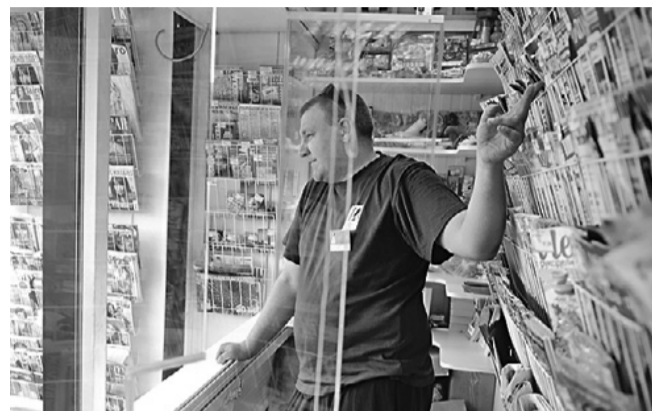
22 августа 2013 года. 14:29 Москва. Модернизированный киоск «Печать» на площади перед станцией метро «Шаболовская»

Другое важное нововведение — изменится порядок сдачи киосков в аренду. Теперь претендовать на точку