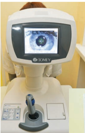
Тонография: контактный метод определения гидро- и гемодинамики глаза (GlauTest-60) Экзибиометрия: определение ПЗО (передне-задней оси глаза) проводится методом ультразвукового сканирования в А-режиме (А-скан биометр AL-1000)