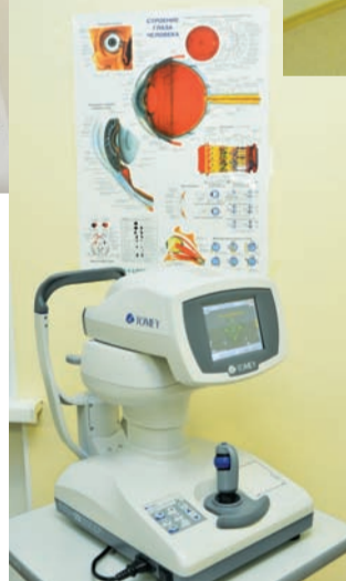
Пневмотонометрия: бесконтактное компьютерное определение показателей ВГ (компьютерный тонометр FT-1000)