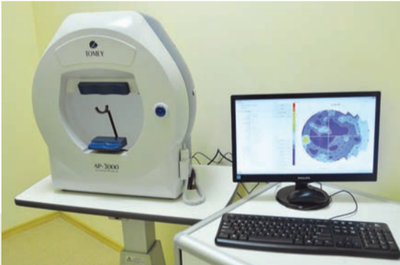
Компьютерная периметрия: оценка периферического и центрального зрения при патологии зрительного нерва и заболеваниях сетчатки (AP-3000)