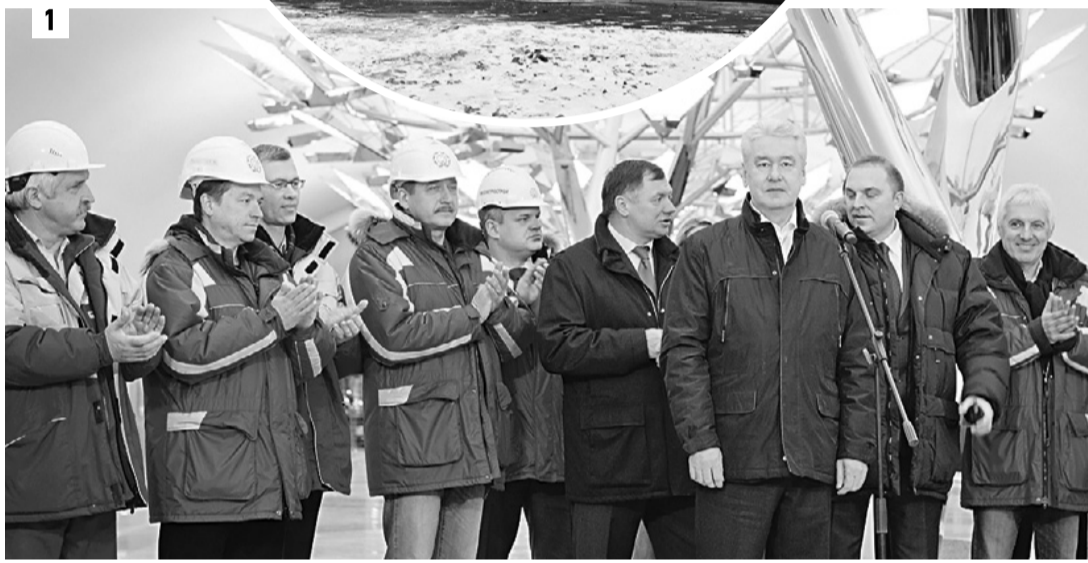
8 декабря 2014 года. 12:08 1 Мэр Москвы Сергей Собянин (на первом плане) и Марат Хуснуллин (слева от мэра), открывая новую станцию метро «Тропарево», поблагодарили метростроителей за отличную работу 2 Вход на станцию сияет мягким, теплым светом 3 Современные турникеты не пропускают безбилетников

Сергей Собянин закрасил маркером на схеме участок красной ветки. После этого градоначальник объявил, что движение поездов