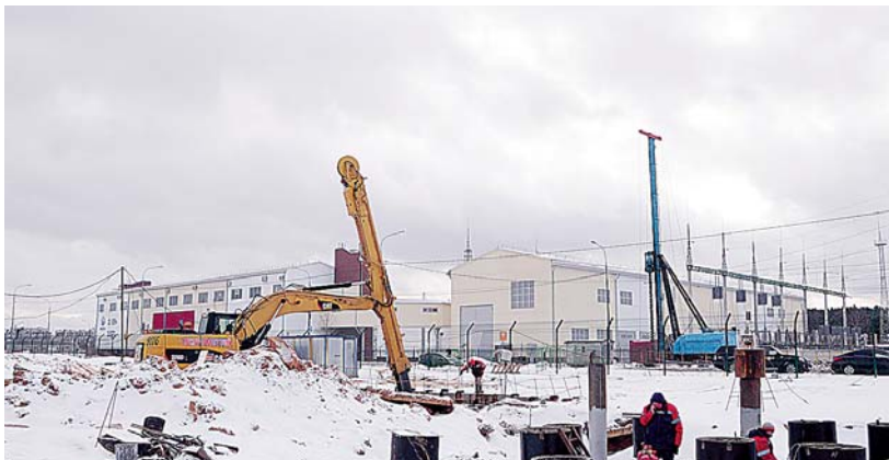
Строительство прокола у подстанции «Сигма»

■ Н. АЛИМЖАНОВА