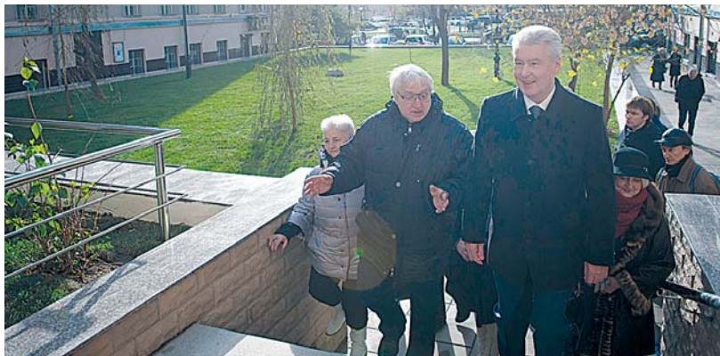
Масштабное благоустройство Ленинградского шоссе и проспекта

При этом благоустройство улиц в нынешнем году будет осуществляться по новым принципам. В основу проектов положено новое понимание безопасности, удобства улиц, сохранения хорошего