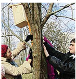
Урок по экологии

В.Рунов отметил, что в Крюково озелененные участки, подведомственные ГПБУ «Мосприрода», расположены вдоль ул. Логвиненко и Михайловка (общая площадь 2,7 га). В целях нормативного и качественного содержания озелененных территорий