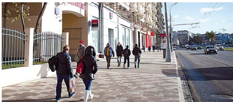
Реконструкция проспекта Мира и Ярославского шоссе

Обеспечение безопасности – это не только традиционное внимание к качеству дорожного покрытия и освещения. В принцип