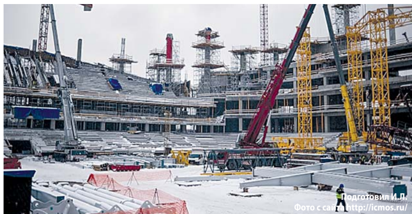
Подготовил И.Л.

Финансирование реконструкции стадиона «Динамо» осуществляется за счет внебюджетных средств.