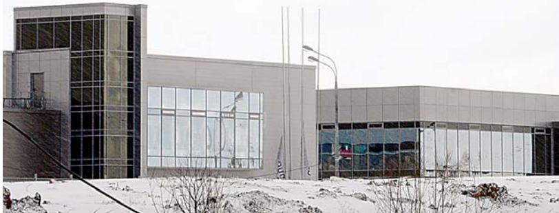
Дата-центр CloudDC Moscow1 и офисное здание ООО «АйЭмТи»

Окончание. Начало в №10 – В каком состоянии находится строительство зданий резидентов ОЭЗ?