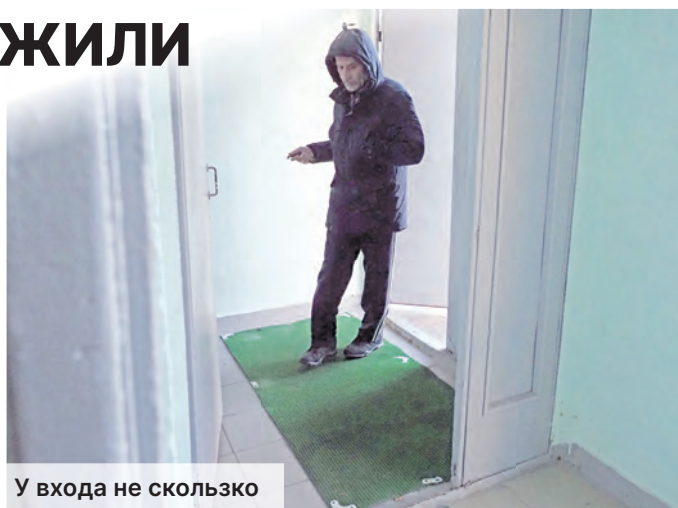
У входа не скользко