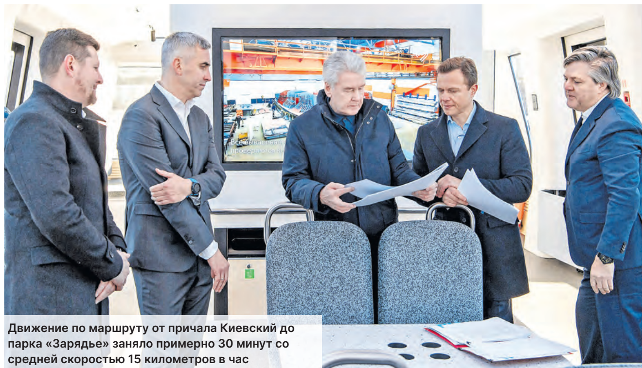
Движение по маршруту от причала Киевский до парка «Зарядье» заняло примерно 30 минут со средней скоростью 15 километров в час

Всего на Москве-реке сделают 23 плавучих причала