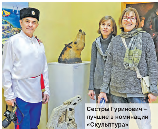
Сестры Гуринович – лучшие в номинации «Скульптура»

Лариса РОМАНОВА, фото из архива хора «Кантилена».