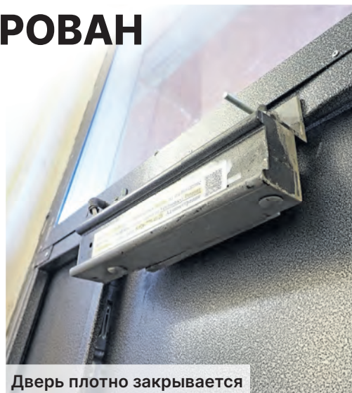
Дверь плотно закрывается

– Сотрудники инженерной службы отрегулировали доводчик на входной двери по адресу, указанному в сообщении. При возникновении подобной ситуации вы можете обратиться в инженерную службу района Старое Крюково в корпус 837 или по телефону 8 (499) 710-4022 с понедельника по четверг с 8.00 до 17.00, в пятницу – с 8.00 до 16.00, перерыв с 12.00 до 12.48. Приносим извинения за доставленные неудобства.