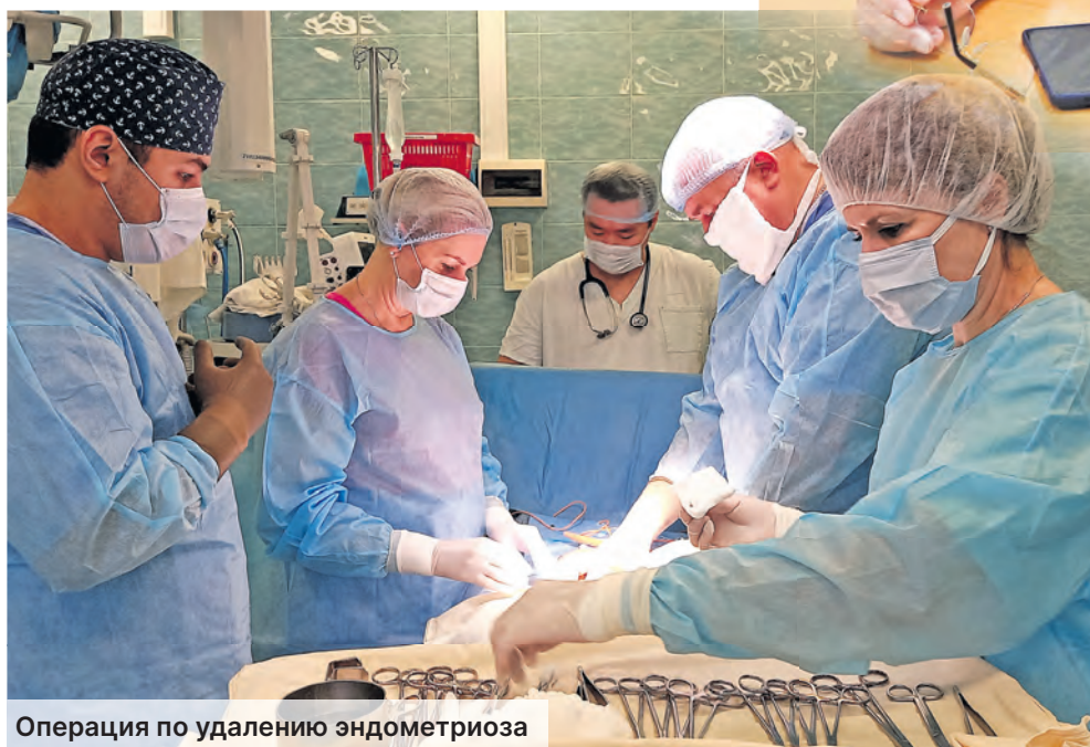
Операция по удалению эндометриоза

диагностику и лечение коварного заболевания – эндометриоза.