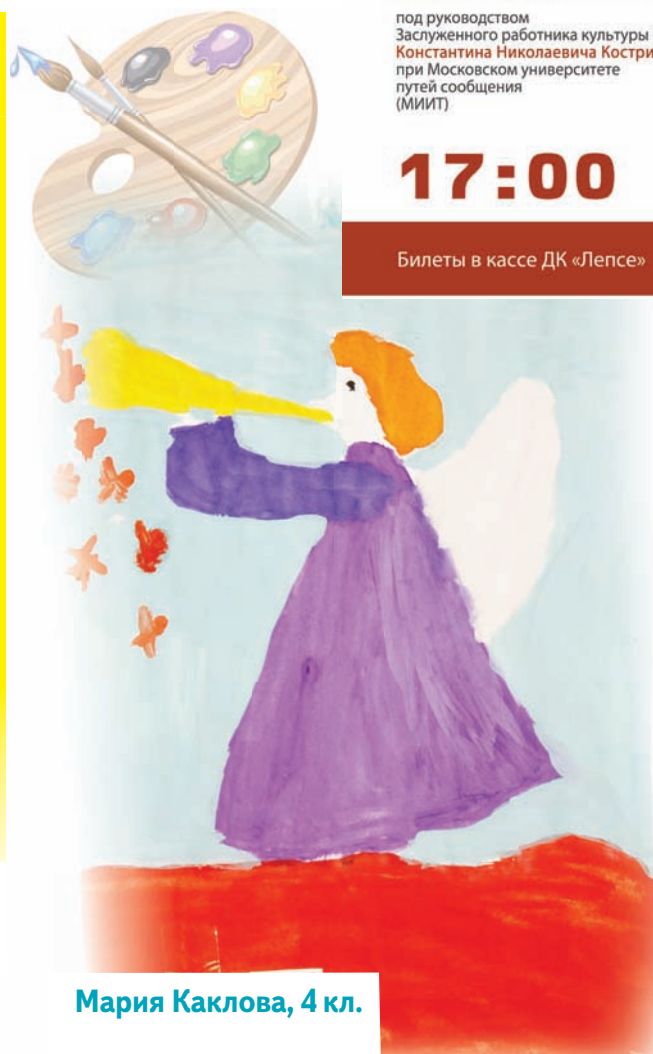
Мария Каклова, 4 кл.