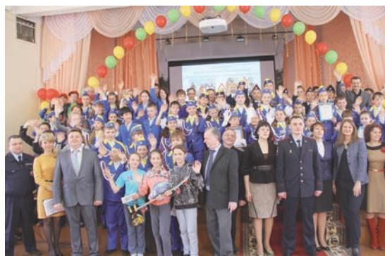
По результатам соревнований определились сильнейшие команды: 1-е место –

В конкурсах, составляющих этапы соревнований, определились лучшие знатоки Правил дорожного движения. Участники продемонстрировали свои знания в оказании первой медицинской помощи пострадавшим, выполнили в автогородке упражнения фигурного вождения велосипеда. В перерыве между конкурсами школьники посетили учебный