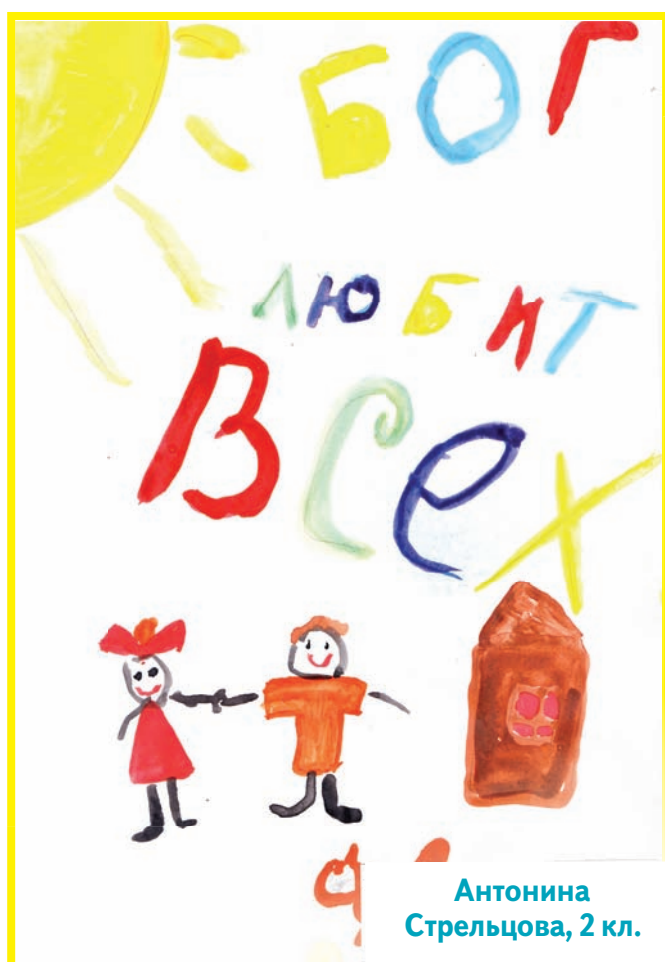
Антонина Стрельцова, 2 кл.