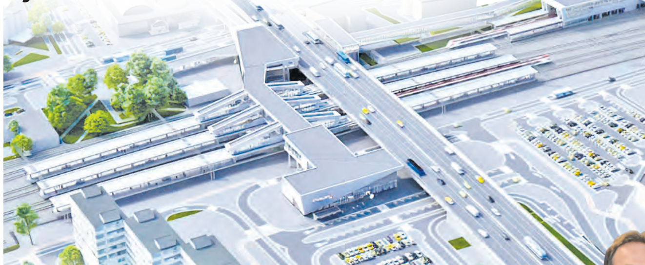
Проект реконструкции станции Крюково (Зеленоград)

■ Мы познакомили читателей с работой действующих МЦД-1 и МЦД-2, проехали по будущей трассе нашего МЦД-3. Теперь посмотрим, что ожидает станцию Крюково (Зеленоград).