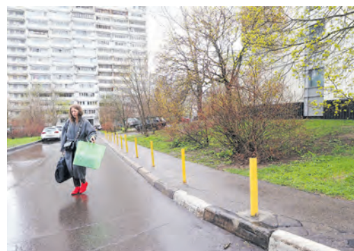
У корпуса 1121