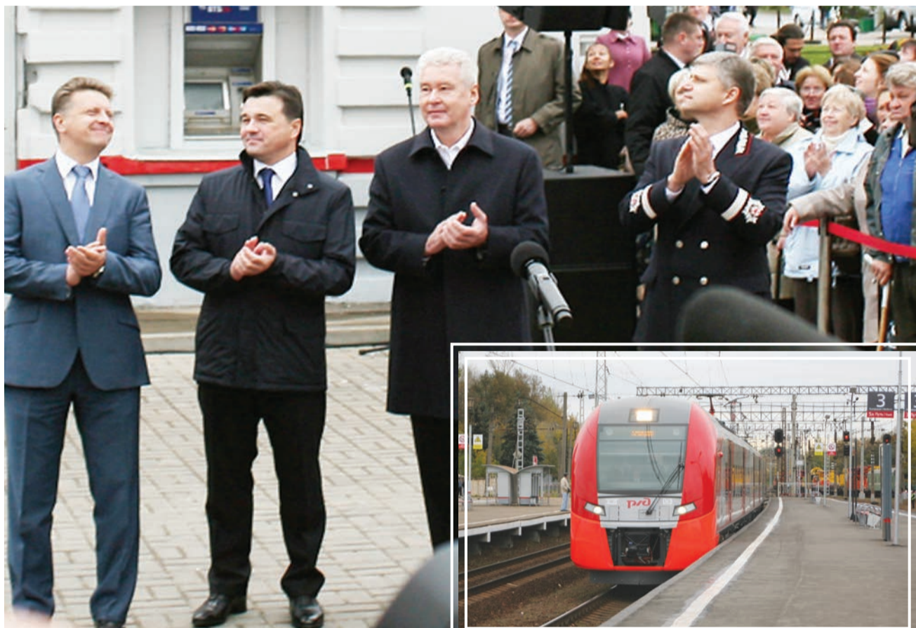
Читайте на стр. 2