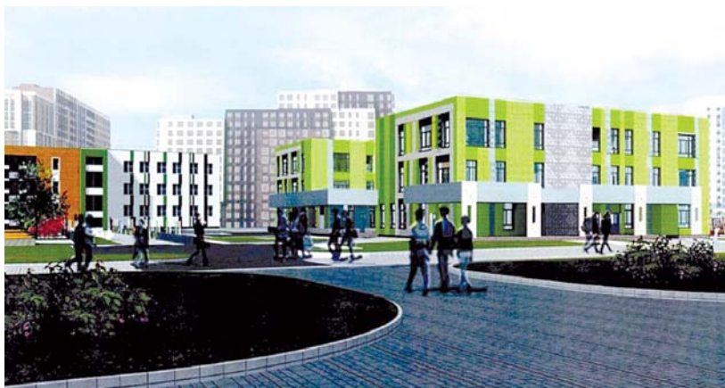
Детский сад 17-го микрорайона рассчитан на 220 мест

Здание детского сада – это 3 блока, соединенные лестницами. Вентилируемый фасад будет вы-