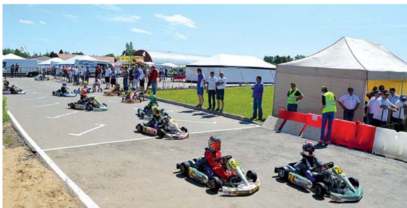
Юные картингисты перед выездом на трассу

На первом этапе, который прошел в 2014-2015 г., трасса была полностью отремонтирована в