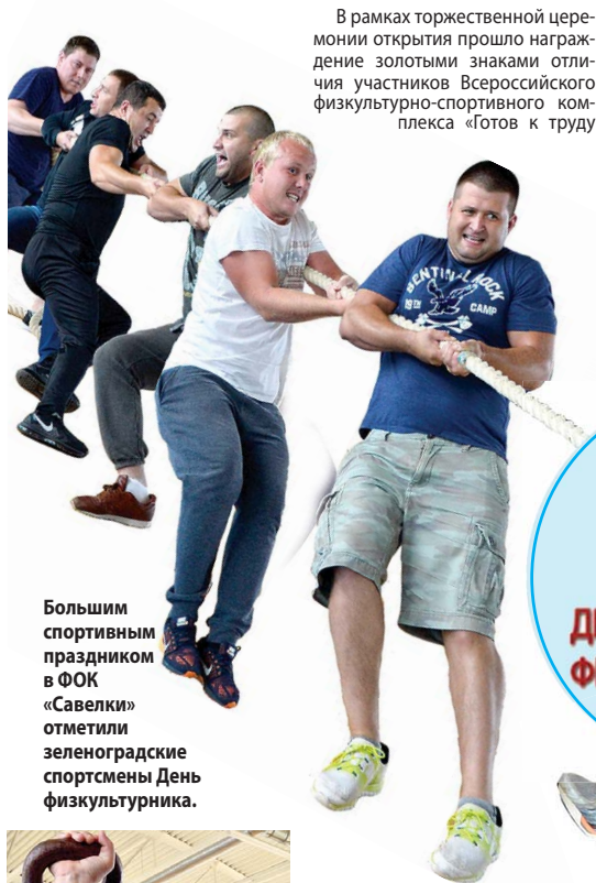
Большим спортивным праздником в ФОК «Савелки» отметили зеленоградские спортсмены День физкультурника.

В рамках торжественной церемонии открытия прошло награждение золотыми знаками отличия участников Всероссийского физкультурно-спортивного комплекса «Готов к труду