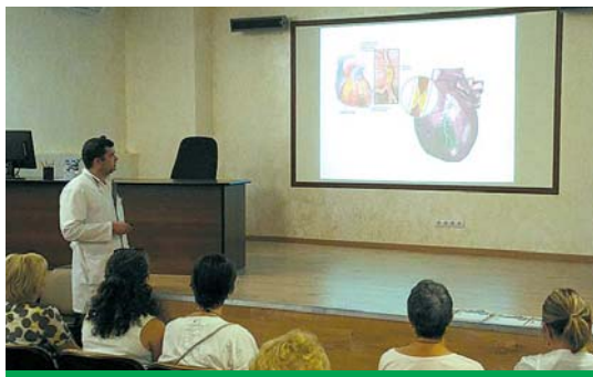
На первом занятии

Инфаркт миокарда – заболевание, обусловленное резким прекращением кровотока в одной или нескольких коронарных сосудах вследствие закупорки их сгустками крови (тромбами) и приводящим к омертвлению части тканей сердца.