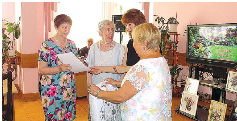
Награждение участников конкурса

И жители района, и депутаты муниципального округа Савелки знают толк в летних днях. И не сидят, сложа руки, стараясь по максимуму порадовать себя и других.