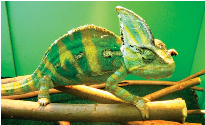
До 18 сентября, с 10.00 до 20.00. Выставка экзотических животных «Зоопарк за стеклом». 3+

«В кассе КЦ «Зеленоград» продолжается продажа абонементов Московского государственного симфонического оркестра для детей и юношества пол управлением з.а. России Дмитрия Орлова на сезон 2016-2017 гг. 9 концертов – 1600 р.