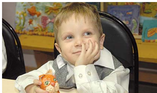
Должно хорошо получиться...