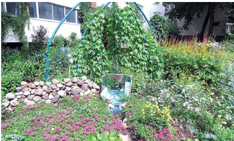
Корпус 618 подъезд 2

накопленные летом, позволяют не унывать долгую зиму – до следующей весны.