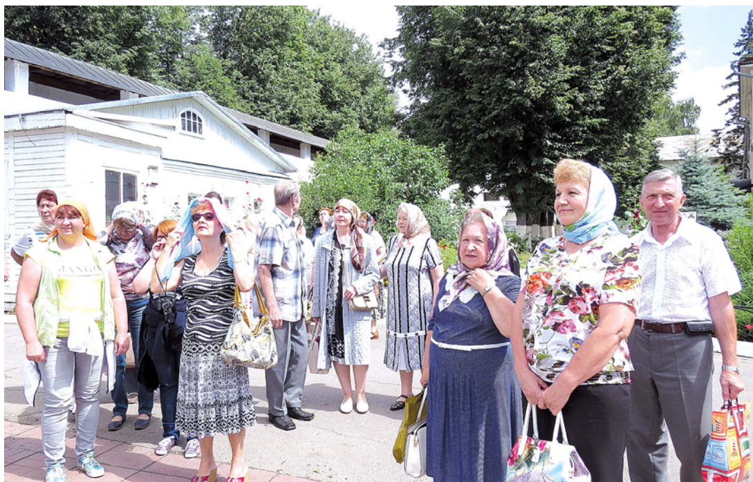
На экскурсии в Саввино-Сторожевском монастыре