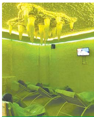
Галокамера в корп. 2042

– Они выгорают в процессе общения с пациентами, потому что у них не приходят люди здоровые,