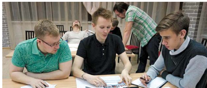
На выходе ребята дают по 70 идей

Так, для детского клуба Гарри Club «штурмовики» придумали