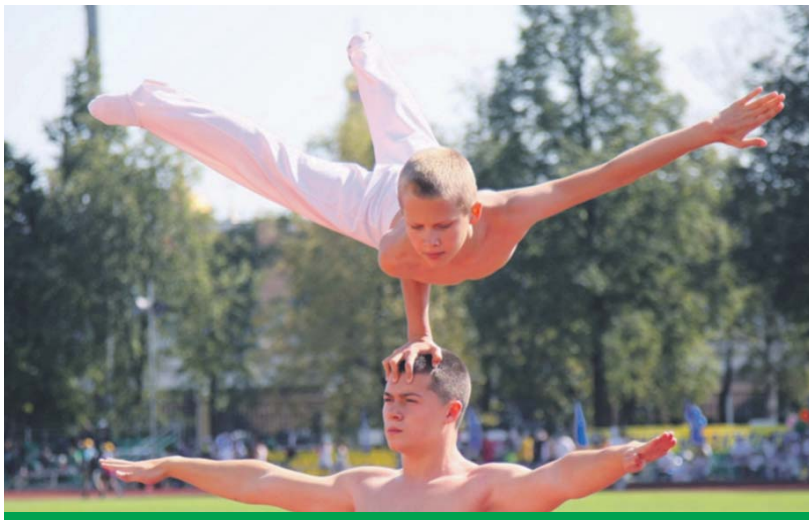
День физкультурника в «Лужниках»

Состязания длились не один час и нужно заметить, что зеленоградские девушки и юноши неизменно оказывались в числе лучших.