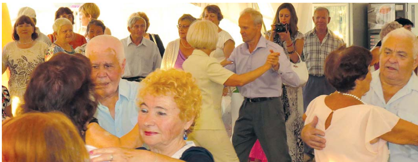
Вечер танцевальной музыки