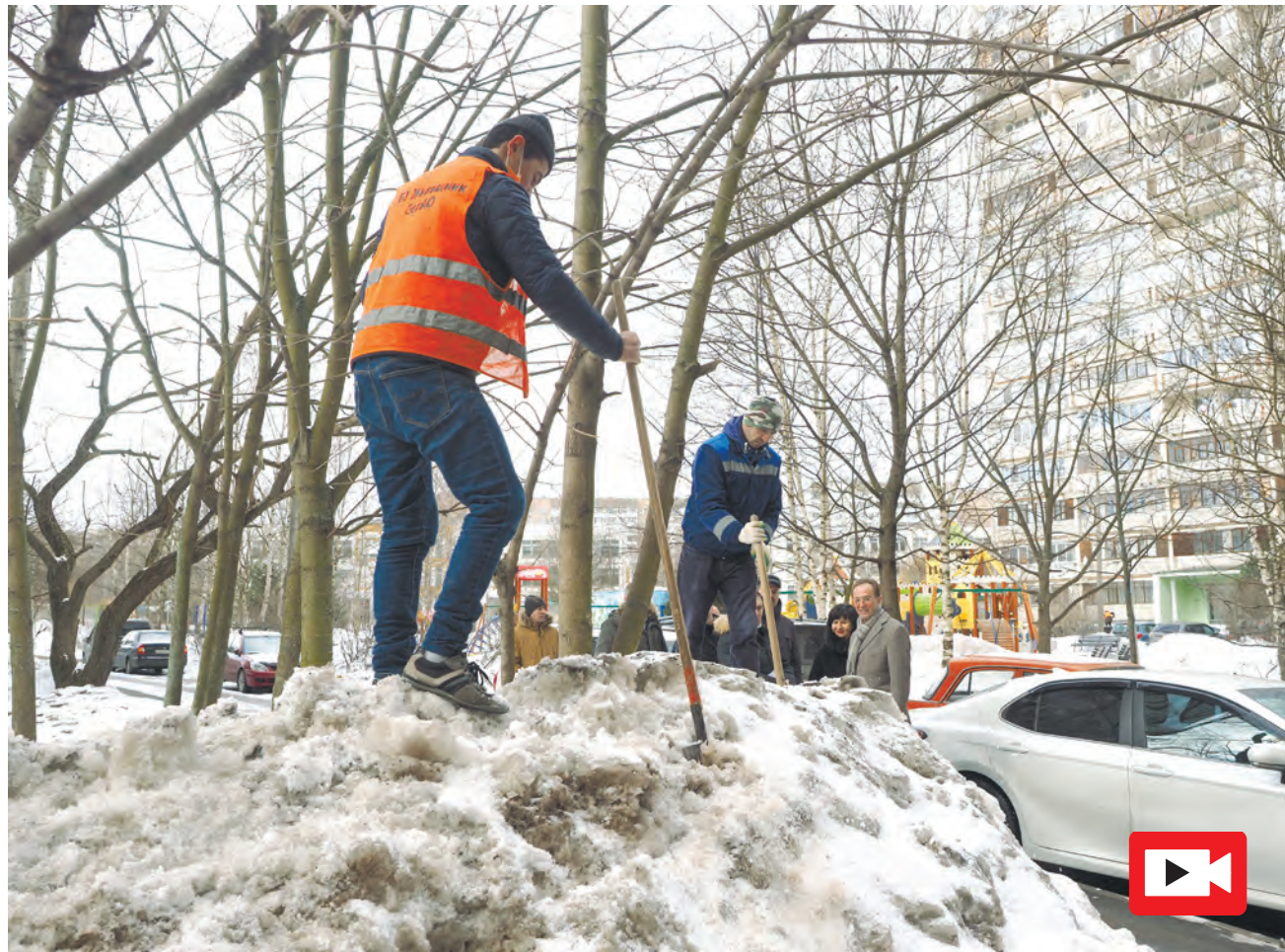
Идет рыхление сугробов для скорейшего таяния снега

Сигналы от жителей о недостаточном качестве уборки дворов поступают постоянно. Поэтому на прошлом оперативном совещании я строго указал главам управ и руководству ГБУ «Жилищник» на то, что, невзирая на погоду, ситуацию надо исправлять. Тогда же принял решение лично объехать все районы города,