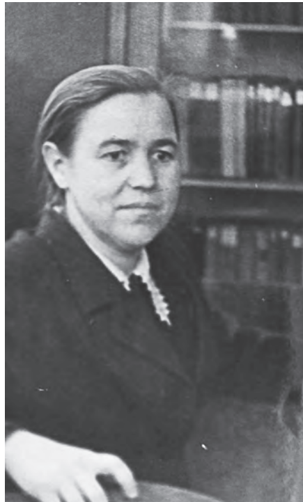
В молодые годы

С мамой ее будущего мужа они вместе работали в совхозе, через нее и познакомились. А он – фронтовик с первых дней, но получил ранение, был начисто комиссован, на Сталинградскую битву уже не попал. Сошлись – и всю жизнь прожили в ладу и согласии.