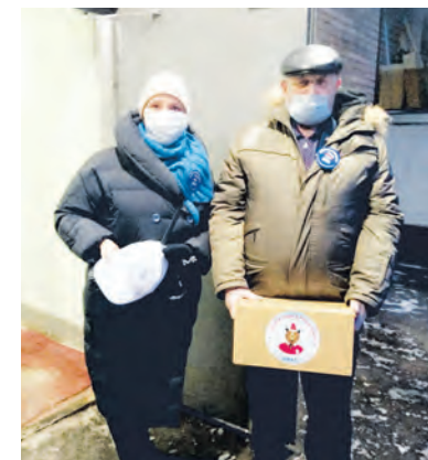
Продуктовые наборы ветеранам

округа Старое Крюково активно участвуют в волонтерском движении Всероссийской политической партии «Единая Россия» и активно поддерживают акции, направленные на помощь гражданам, нуждающимся в поддержке.