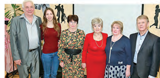
Фото из архива 2019 года

многими зеленоградцами. И артисты отвечают своим поклонникам тем же – любовью и уважением. Они с удовольствием выступают с концертными программами не только на сцене родного филиала «Солнечный», но и на других площадках ЗелАО. Коллектив пользуется большим успехом