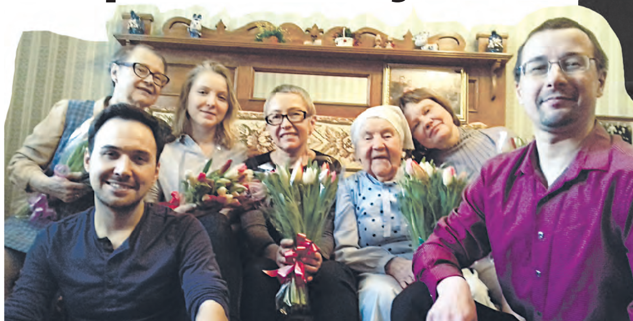
Вся семья в сборе