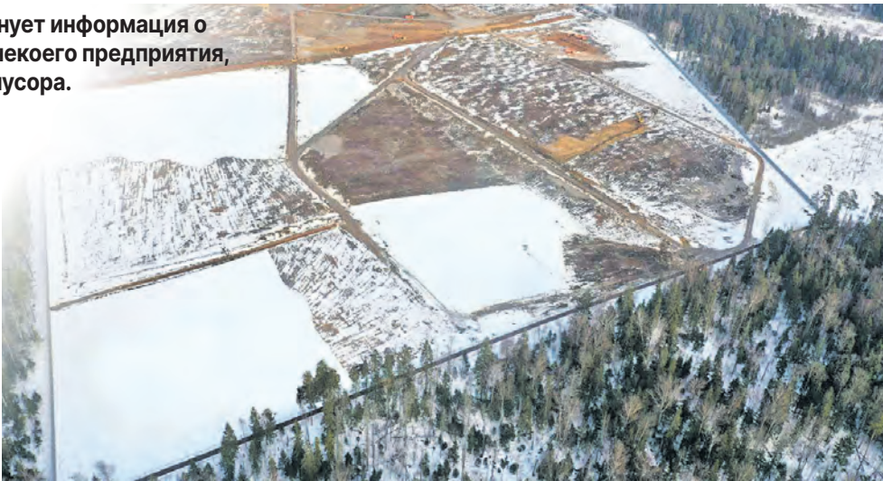
Так сейчас выглядит стройплощадка КПО в Поварово