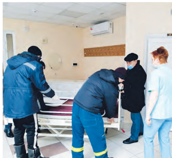
Акция «С заботой о ближнем»