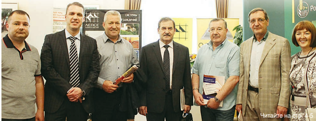
Читайте на стр. 4-5