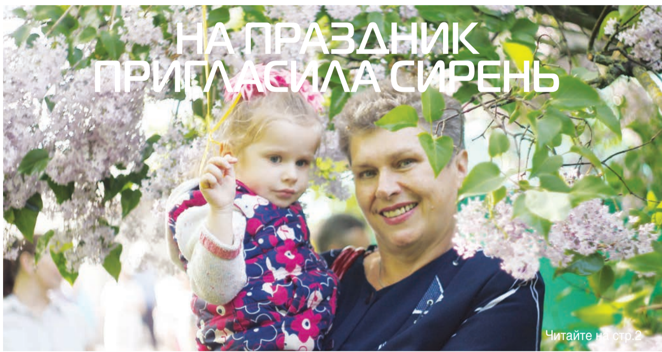
Читайте на стр. 2