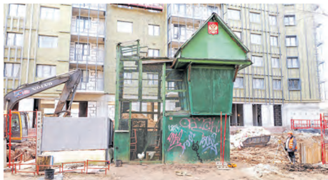
Голубятня около стройки корпуса 901А

На самом деле, птицы тут совсем ни при чем. Ну, почти. Они разве что могут мешать своим шумом жителям ближайших домов. К примеру, несколько лет назад жители корпуса 902А жаловались на голубятню, расположенную у долго строя в 9-м микрорайоне. Только вот бедные голуби тут снова ни при чем. Людей беспокоили крики петухов,