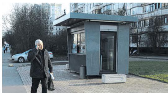
Цветники не пропускают транспорт