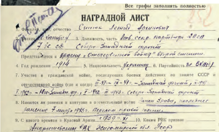
Наградной лист за получение ордена Отечественной войны II степени

Подготовила Анастасия ИВАНОВА по материалам совета ветеранов 19-го микрорайона Крюково