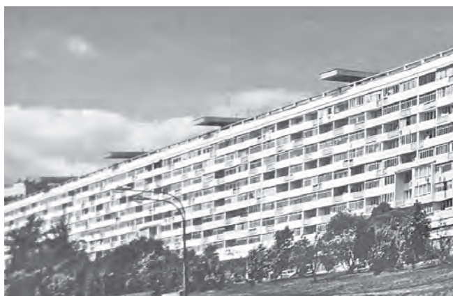
Из книги «Москва: гид по архитектуре советского модернизма» 1955 - 1991 годы

■ Продолжая тему центра Зеленограда, нельзя обойти вниманием уникальный для нашего города корпус 360, который все знают как жилой дом «Флейта».