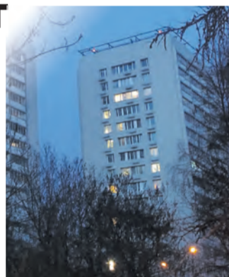
Габариты жилых домов заметны с неба

– Работники ГБУ «Жилищник ЗелаО» восстановили работу сигнальных огней, расположенных на кровлях корпусов 401, 402, 406, 407, 435, 436, 438, 439. Благодарим вас за активную жизненную позицию.