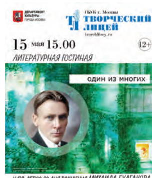
К 130-ЛЕТИЮ СО ДНЯ РОЖДЕНИЯ МИХАИЛА БУЛГАКОВА

Гости вечера узнают малоизвестные факты из жизни писателя, а также посмотрят слайд-шоу из архивных документов и фотографий. Вход свободный. 12+