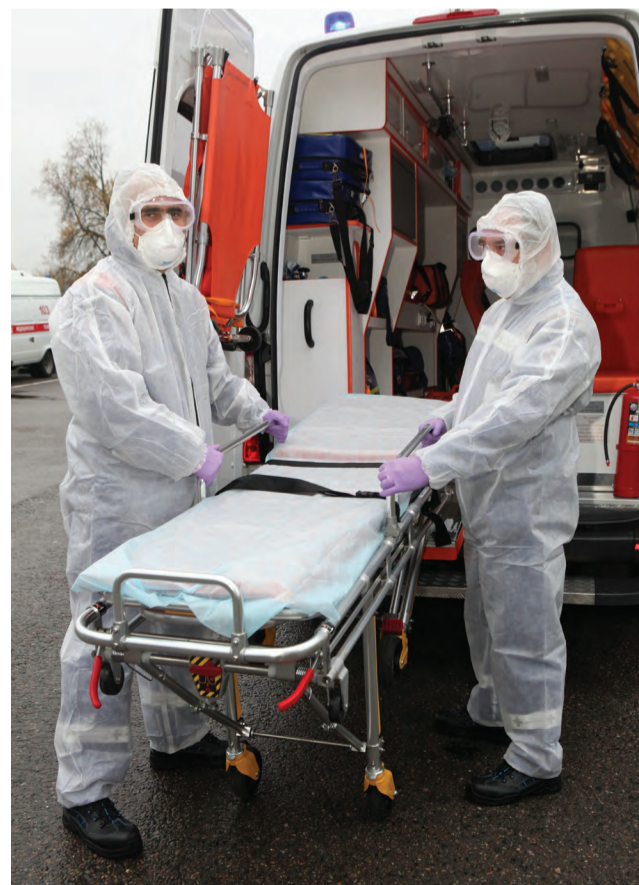
Бригада подстанции скорой помощи №57, Зеленоград

По словам мэра, пандемия стала серьезным экзаменом для системы городского здравоохранения. Скорая помощь Москвы – одна из мощнейших систем в мире и по скорости вызовов: в прошлом году на экс-