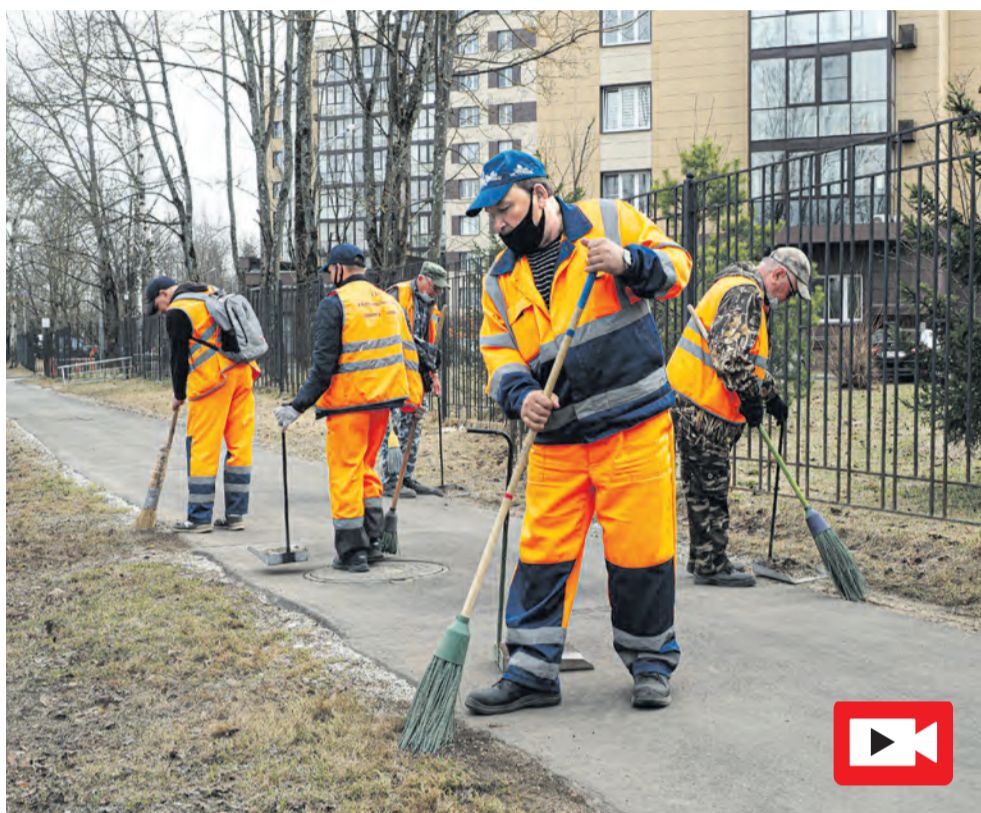
Весенняя уборка города заканчивается

Значит ли это, что в будущем мы полностью откажемся от практики городских субботников? Конечно, нет. Объединенный труд горожан на весенней и осенней уборке города имеет огромное значение не только в качестве помощи службам ЖКХ. Эта помощь важна. Но еще важнее тот факт, что жители, лично