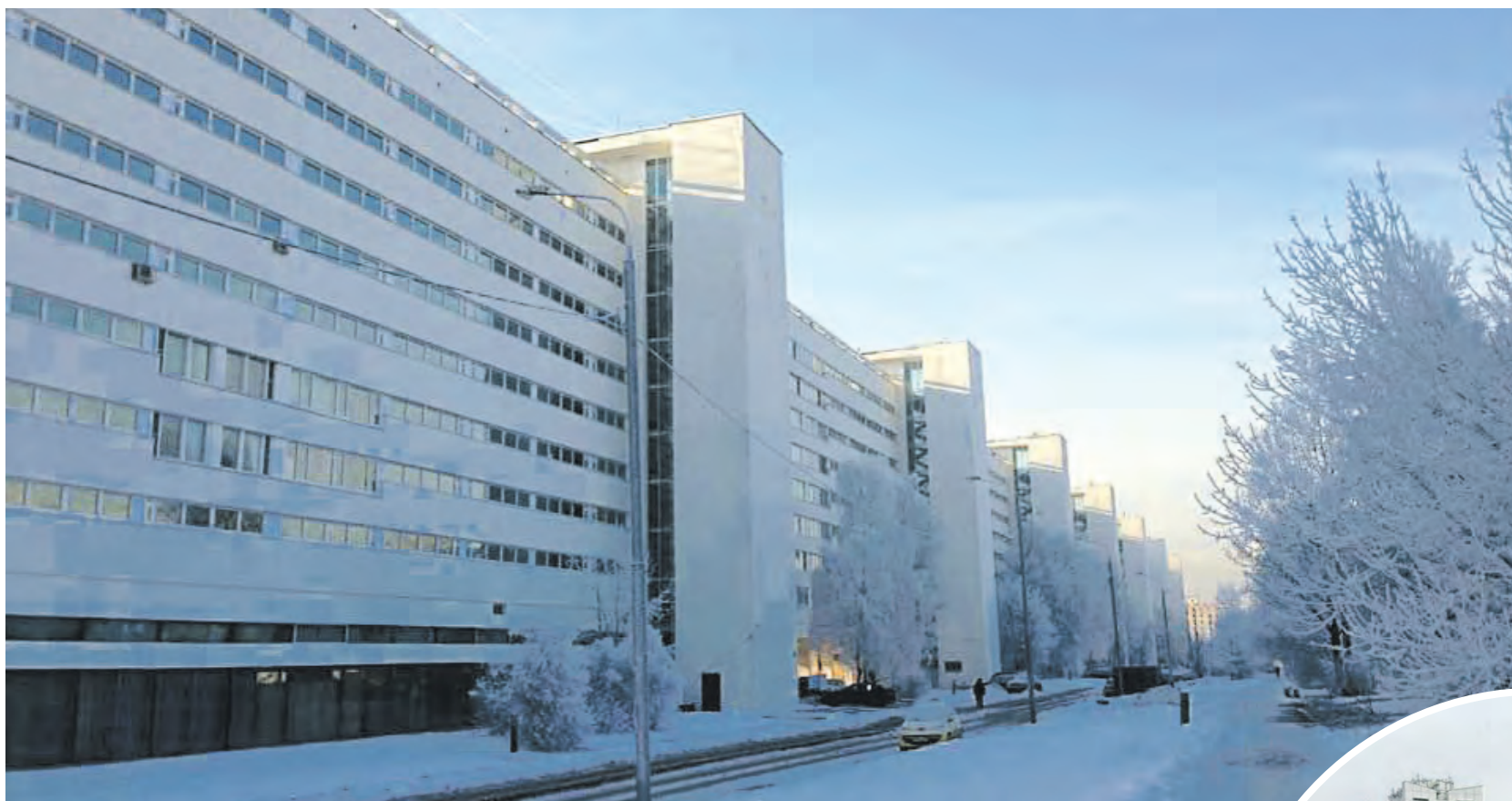
2015 год. Здание «Флейты» после капитального ремонта. Северный фасад