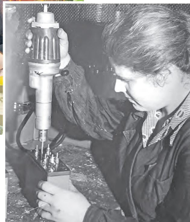
На заводе имени Ф.Э. Дзержинского