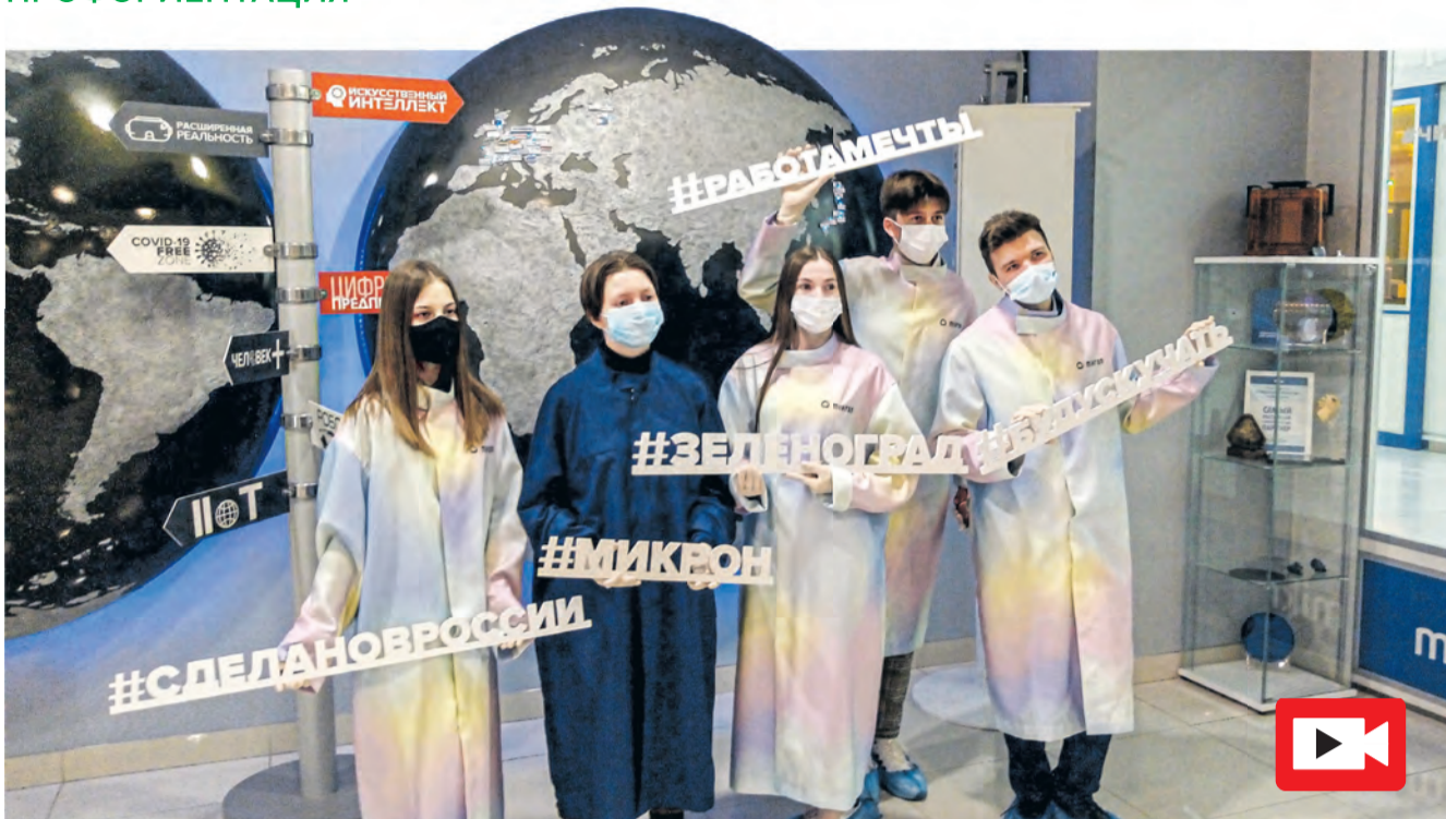
Победители профориентационного урока «Лифт в будущее» со своими кураторами на «Микроне»