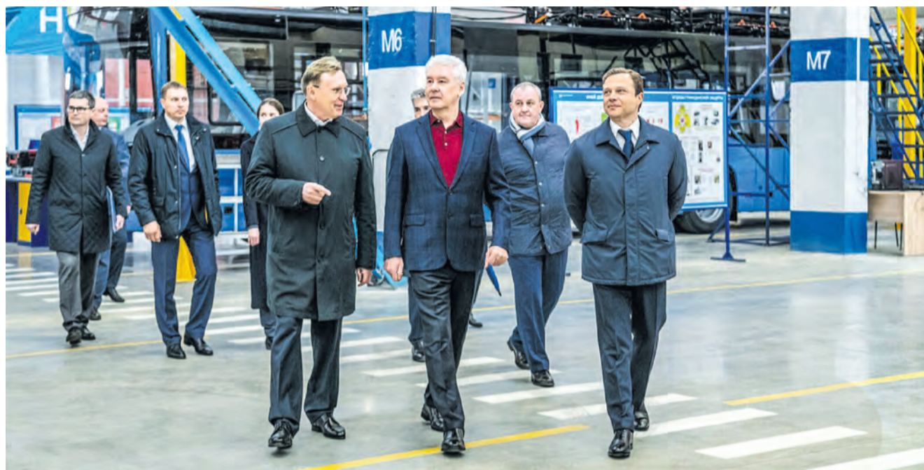
Генеральный директор ПАО «КамАЗ» Сергей Когогин, мэр Москвы Сергей Собянин и заместитель мэра Москвы по вопросам транспорта Максим Ликсутов (слева направо на первом плане) во время посещения центра по производству электробусов на территории Сокольнического вагоноремонтно-строительного завода

Созданные производственные мощности рассчитаны на сборку до 500 электробусов в год. В Москве будут проводить около