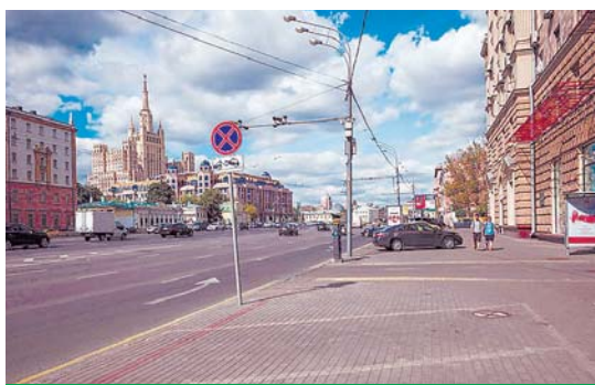
Садовое кольцо сегодня

В институте медиа, архитектуры и дизайна «Стрелка», одном из главных разработчиков концепций реконструкции улиц столицы, прошла презентация концепций благоустройства территории Москвы – «Моя улица»: как будут выглядеть Садовое и Бульварное кольца». Авторы концепций рассказали и показали, как изменится город после завершения строительных работ.