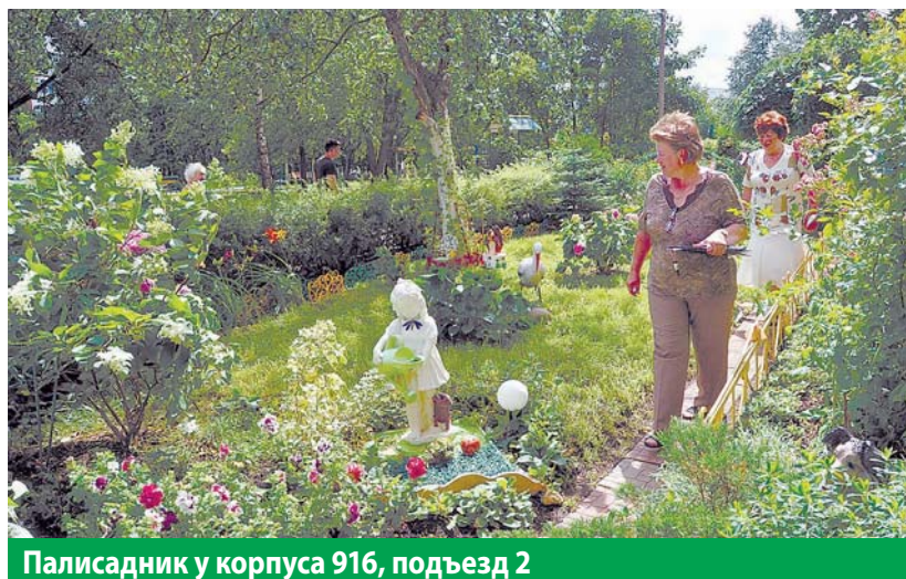
Палисадник у корпуса 916, подъезд 2