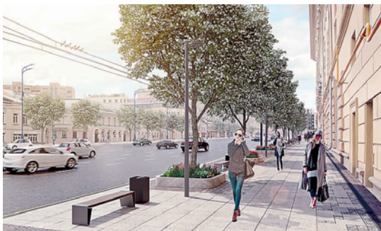
Садовое кольцо после реконструкции

Главная задача программы – создать комфортную городскую среду и сделать Москву местом, удобным для жизни. Но эта программа не только затратная, ее реализация даст и экономический эффект: дружелюбная, комфортная обстановка на городских улицах дает возможность развиваться бизнесу торговли и услуг, способствует привлечению большего количества туристов. Опыт показал, что на тех улицах, где реконструкция уже завершена, от двух до четырех-пяти раз возрастает количество пешеходов, растет популярность велодвижения. Как следствие, многократно увеличивается количество кафе, ресторанов, магазинов и других объектов обслуживания на первых этажах домов. Появляется простор для проведения массовых фестивалей и городских праздников.