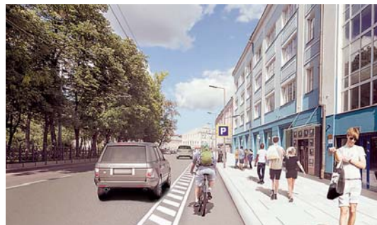
Бульварное кольцо после реконструкции