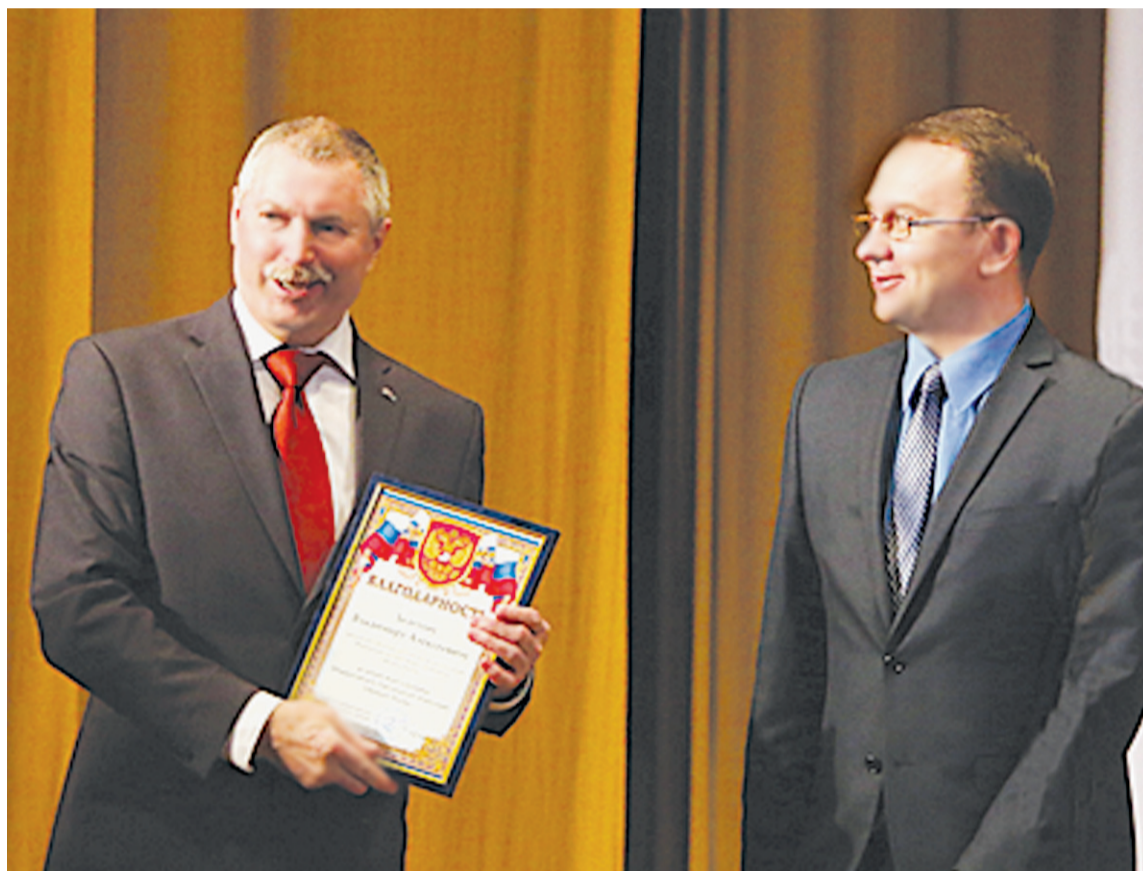
В ДК «Выстрел» прошло общее собрание Солнечногорского отделения Общероссийской общественной организации «Офицеры России»

Издательский дом СОРОК ОДИН Москва, Зеленоград