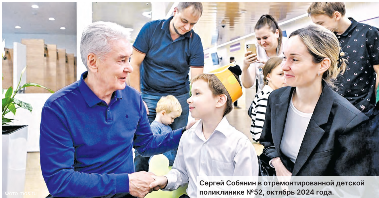
Сергей Собянин в отремонтированной детской поликлинике №52, октябрь 2024 года.

В Зеленограде к новому московскому стандарту приведен филиал №3 детской городской поликлиники №105 в корпусе 225А. Пациентов встретили обновленные кабинеты, холлы и коридоры. В поликлинике создана удобная навигация,