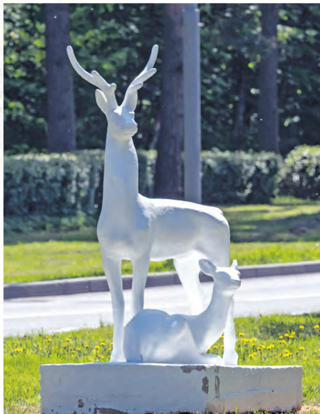
На Московском проспекте установлена отреставрированная скульптура ланей.

Кроме этого, в 7-м микрорайоне отремонтированы три спортивные площадки. На универсальной спортплощадке постелили новое резиновое покрытие, установили футбольные ворота, заменили баскетбольные щиты с кольцами. В зоне воркаута появилось современное спортивное оборудование: тренажеры и комплексы. А на резиновом покрытии теперь приятно тренироваться. Также было заменено покрытие площадки для игры в настольный теннис и установлены два новых теннисных стола.