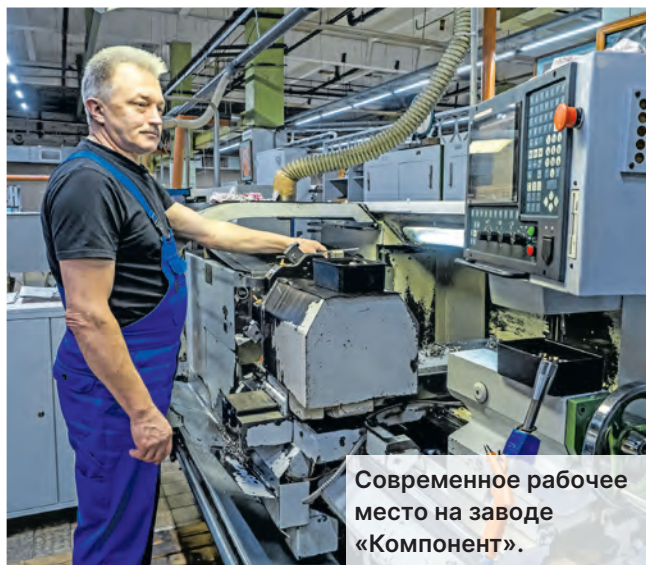
Современное рабочее место на заводе «Компонент».

К сожалению, долгое время ни государство, ни сами предприятия, занятые текущими проблемами, в плане подготовки рабочих кадров на перспективу не работали. Сегодня мы пожинаем плоды: умелых рук не хватает.