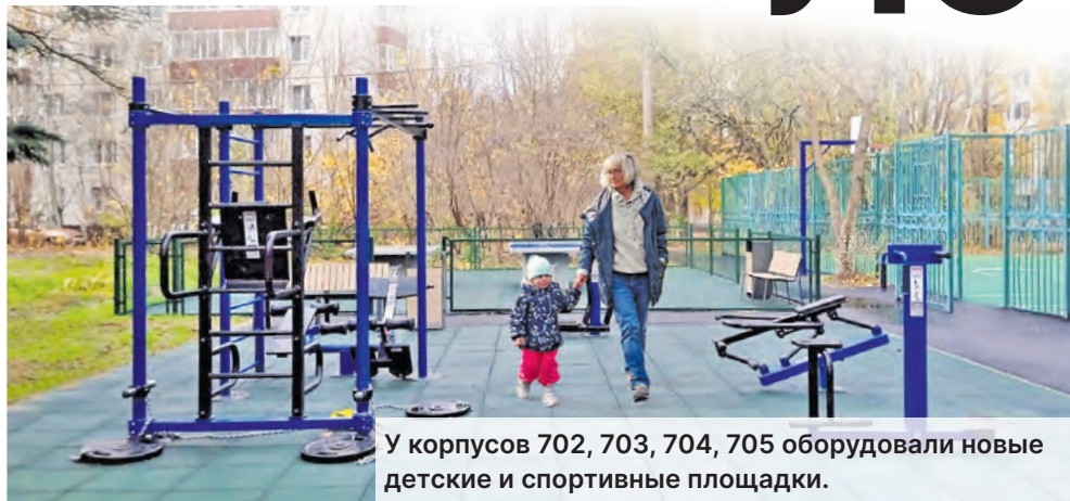
У корпусов 702, 703, 704, 705 оборудовали новые детские и спортивные площадки.

Масштабное и локальное благоустройство никогда не обходило стороной район Савелки. Несколько лет назад реконструирован главный в округе парк – 40-летия Победы. Большой городской пруд был очищен, а вокруг него создали пешую прогулочную зону с деревянным настилом. Был реконструирован Центральный проспект. В прошлом году привели в порядок пешеходную зону между аллеей Лесные пруды и Никольским проездом.