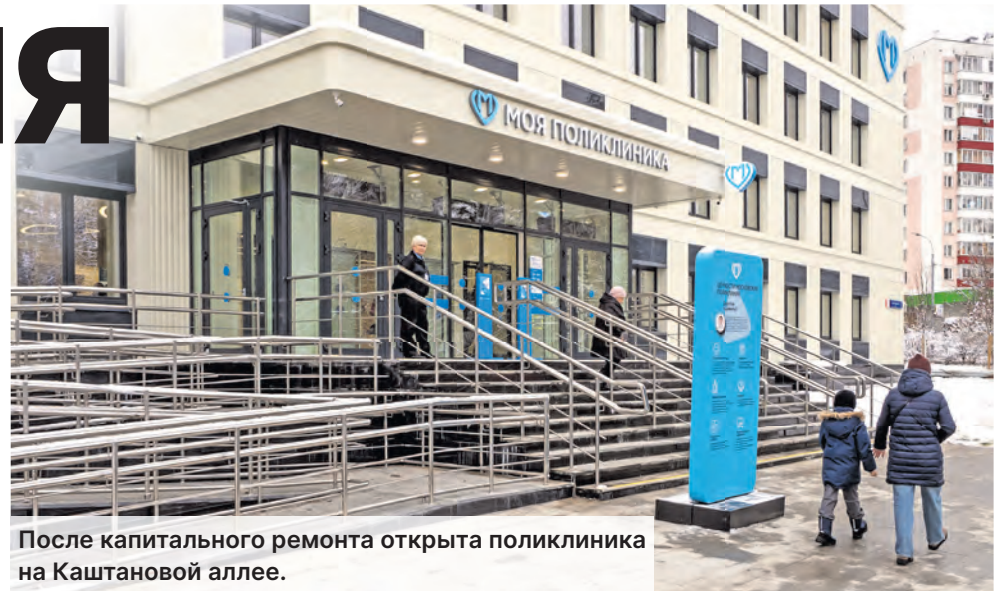
После капитального ремонта открыта поликлиника на Каштановой аллее.

Большим событием для жителей района Савелки стало завершение реконструкции взрослой поликлиники на Каштановой