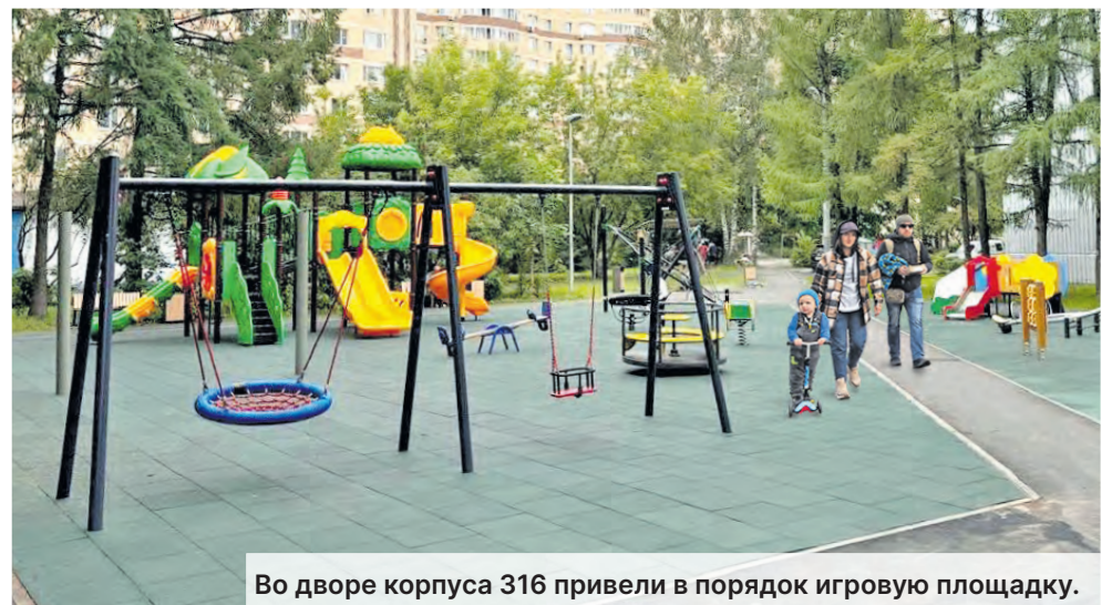
Во дворе корпуса 316 привели в порядок игровую площадку.

Евгений АНДРЕЕВ, фото Дмитрия ЕРОХИНА, опрос провел Артем КАБАНОВ