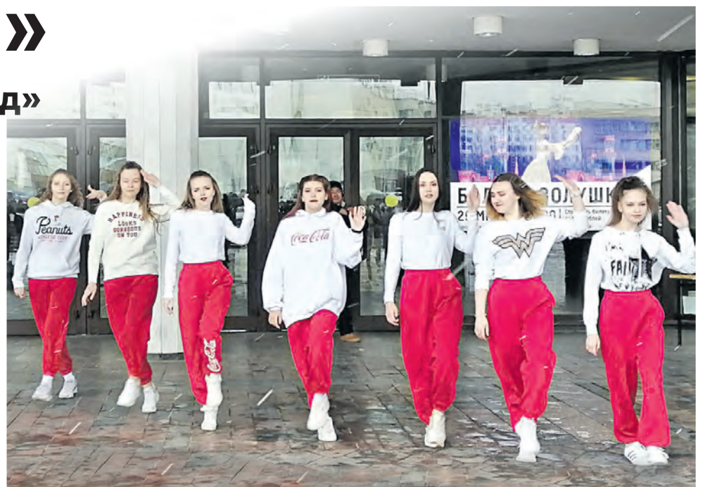
Коллектив после выступления в Культурном центре «Зеленоград»

Дарья ГРИШИНА, фото из архива ансамбля «Галас»