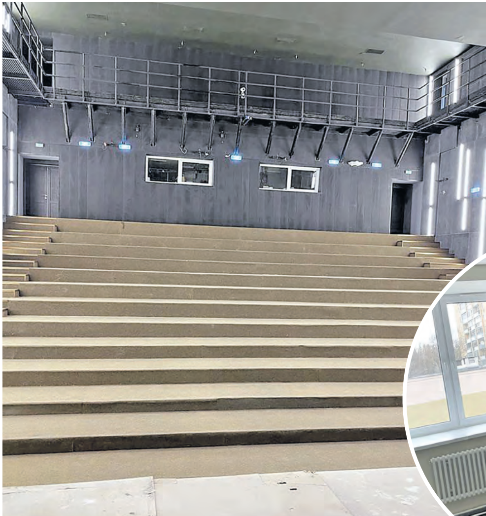
Вид большого зала со сцены, пока пустой...

А до конца сезона провести презентацию на большой сцене.