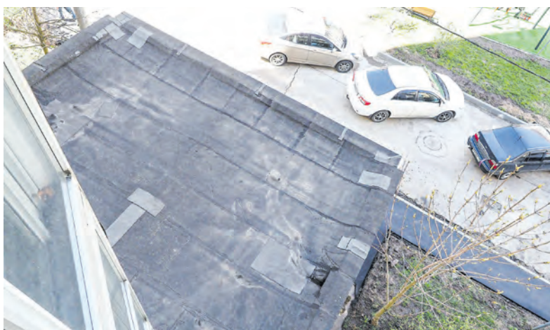
На козырьке чисто

– Просьба привести в порядок козырек над подъездом 2 корпуса 237, убрать мусор. Галина ТИТОВА, корп. 237