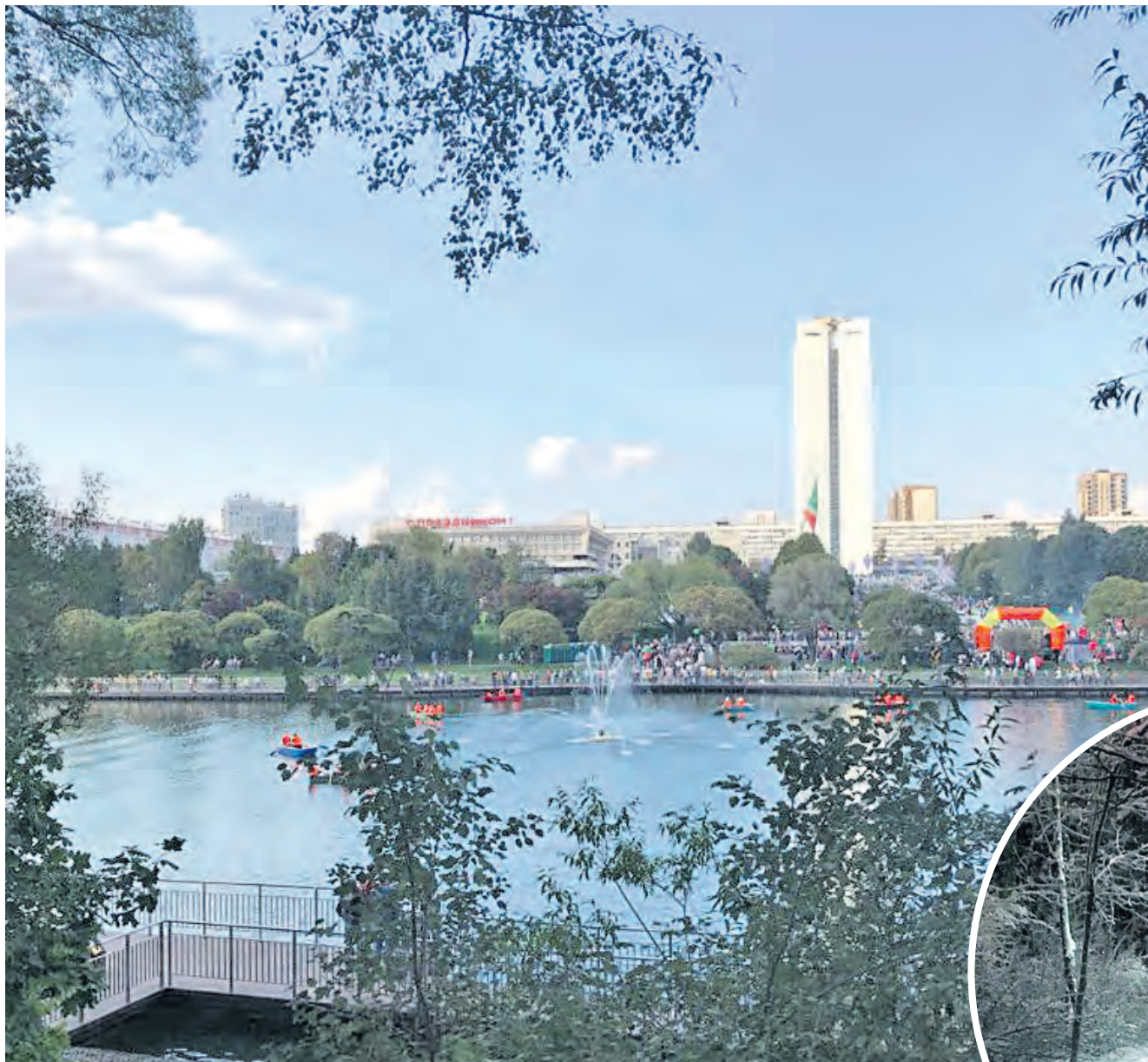
Парк Победы в день открытия после реконструкции