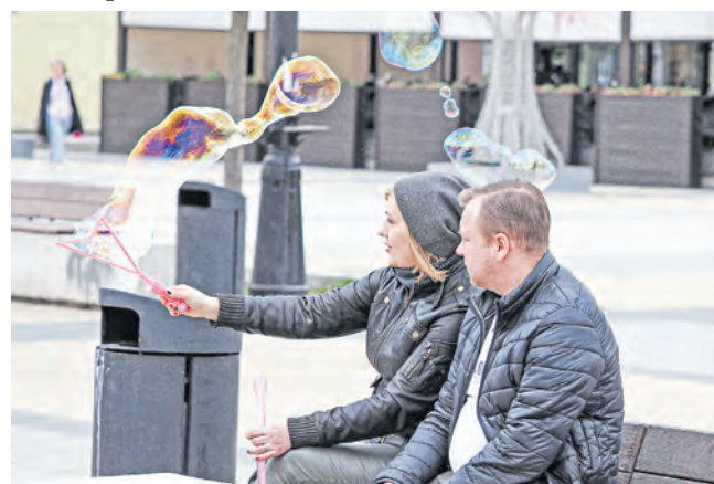
Пара отдыхает на площади Юности