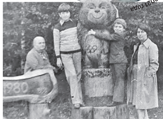
Архивное семейное фото. 1980 год. Парковая скульптура «Олимпийский Мишка»