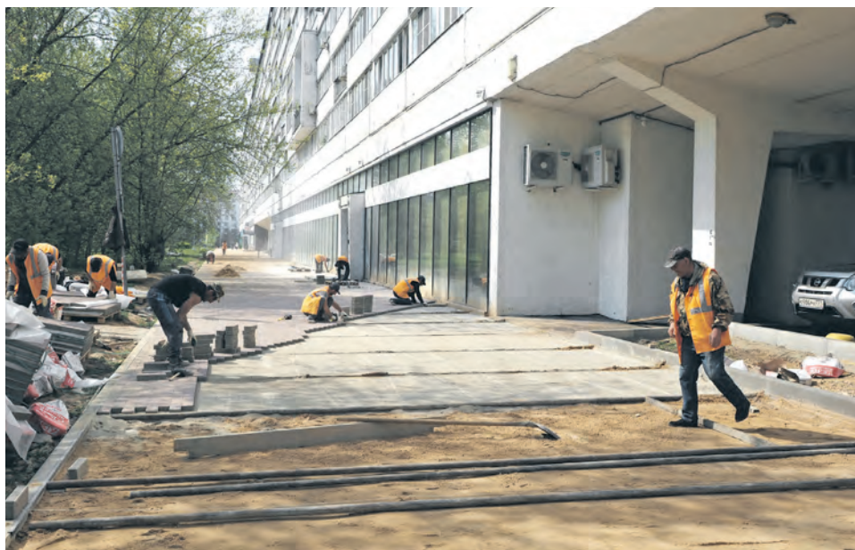
Работы в сквере «Флейта» (корп. 360) по программе «Мой район»