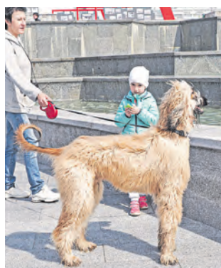
Красавчик по кличке Альф в парке Победы

■ Размеренно и не спеша по парку 40-летия Победы гуляют люди. Кто-то выбрался на променад целой семьей, а кто-то дышит весенним воздухом, наполненным ароматами расцветающих деревьев, в гордом одиночестве.