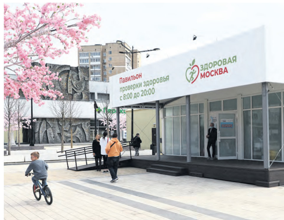
Павильон на площади Юности в Зеленограде

документы». И самое важное: пациенты, у которых выявят проблемы во время первичного обследования, не будут забыты. К проекту подключится телемедицинский центр, хорошо зарекомендовавший себя в период пандемии. Его врачи будут сопровождать москвичей до полного завершения обследования, постановки диагноза и назначения лечения.