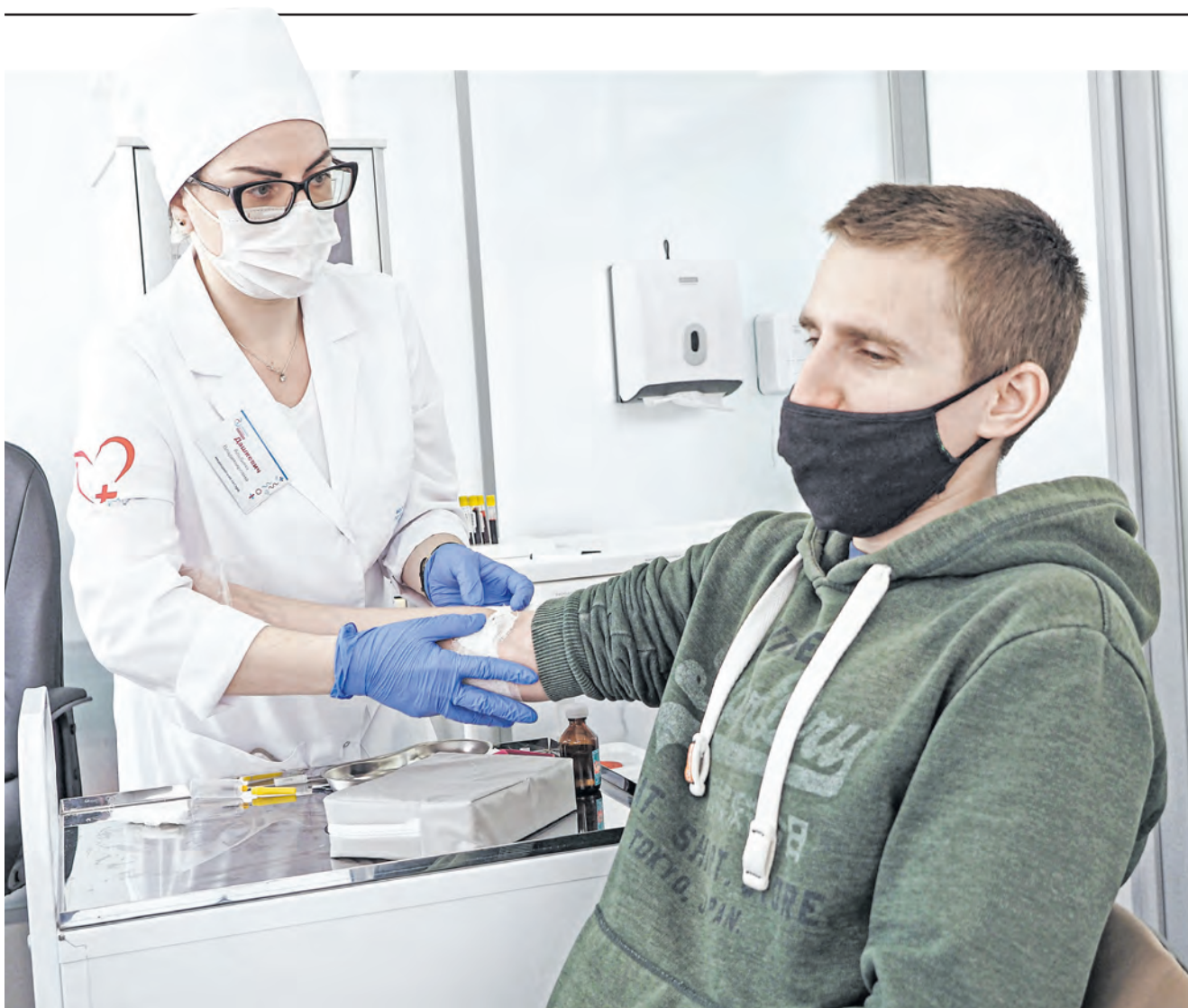
В павильоне «Здоровая Москва» на площади Юности