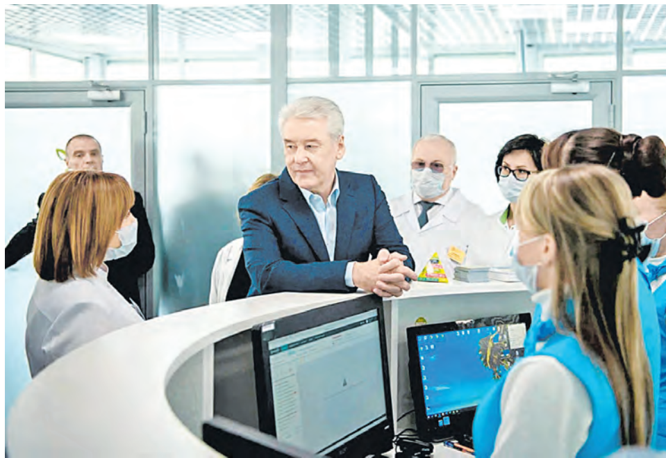
Сергей Собянин открыл павильон «Здоровая Москва» в Измайловском парке

■ В этом году в московских парках, скверах и зонах отдыха будут работать 46 павильонов «Здоровая Москва», в том числе на площади Юности в Зеленограде, ежедневно с 8.00 до 20.00.