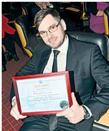
Окончание. Начало на стр. 1.

В этом году жюри определило 10 абсолютных победителей, 5 победителей в специальной номинации «Стабильные результаты работы и эффективное управление», 45 победителей в 16 отраслевых номинациях, а также 11 менеджеров в номинации «Команда года».