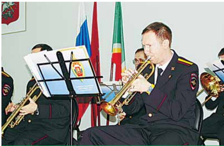
Оркестр Культурного центра ГУ МВД России

За 2015 г. в УВД оказано 4275 государственных услуг. Организован мониторинг качества предоставляемых госуслуг.