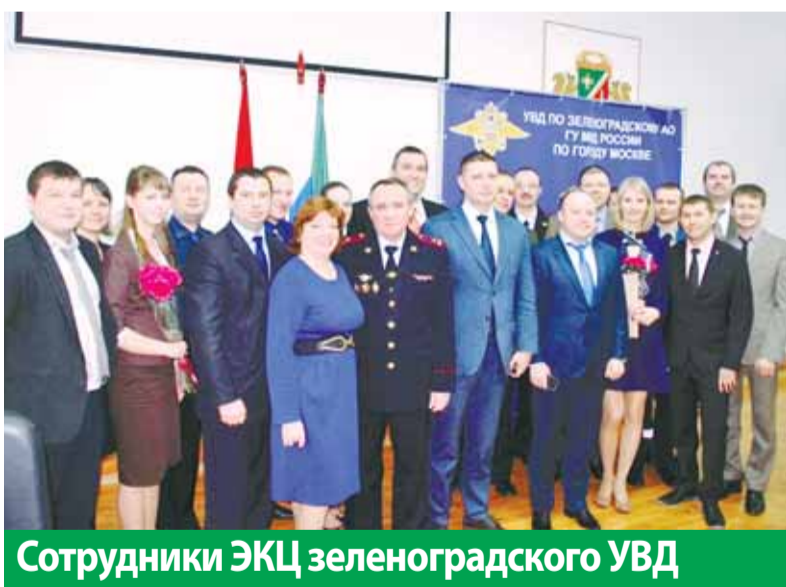
Сотрудники ЭКЦ зеленоградского УВД

В УВД по ЗелАО состоялось торжественное поздравление сотрудников экспертно-криминалистического центра с 97-летием со дня основания службы.