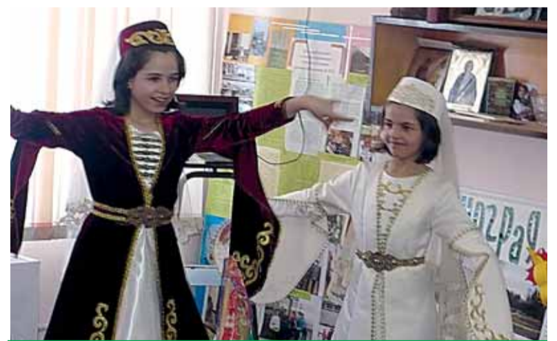
Презентация Республики Ингушетия в школе