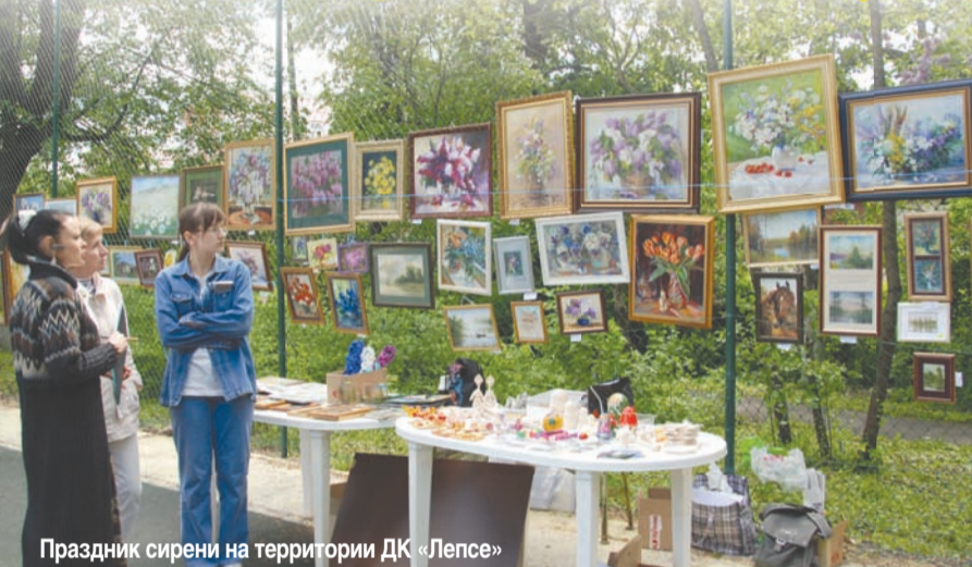
Праздник сирени на территории ДК «Лепсе»

дети и взрослые приобщаются к искусству, покупают краски, кисти, пластилин. И это прекрасно, они заняты прекрасным делом – творчеством.