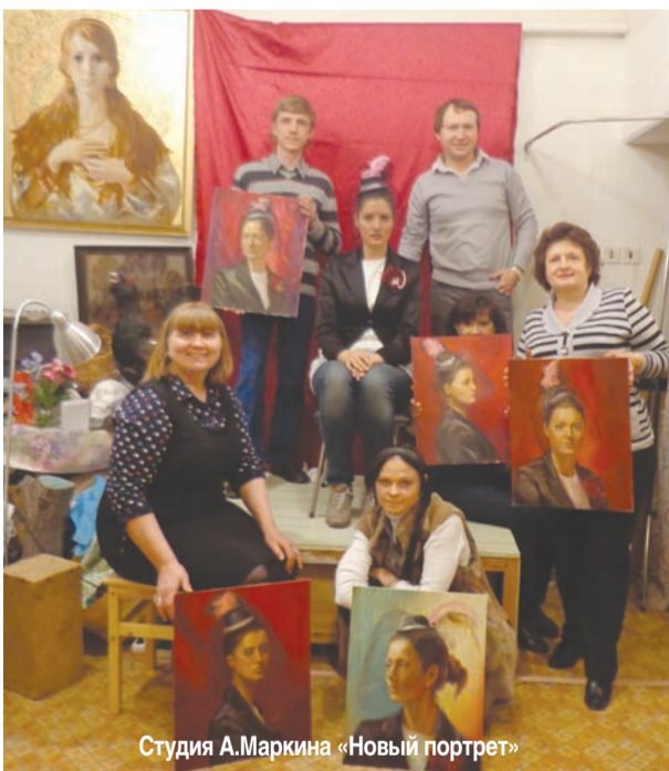
Студия А.Маркина «Новый портрет»

желания здоровья и так держать, развиваться. Надеюсь, власти города и района будут этому способствовать.