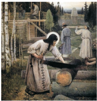
Картина М.В.Нестерова. Труды Преподобного Сергия

В первой половине XIV века русские монастыри переживали не лучшие времена. С точки зрения монашеского