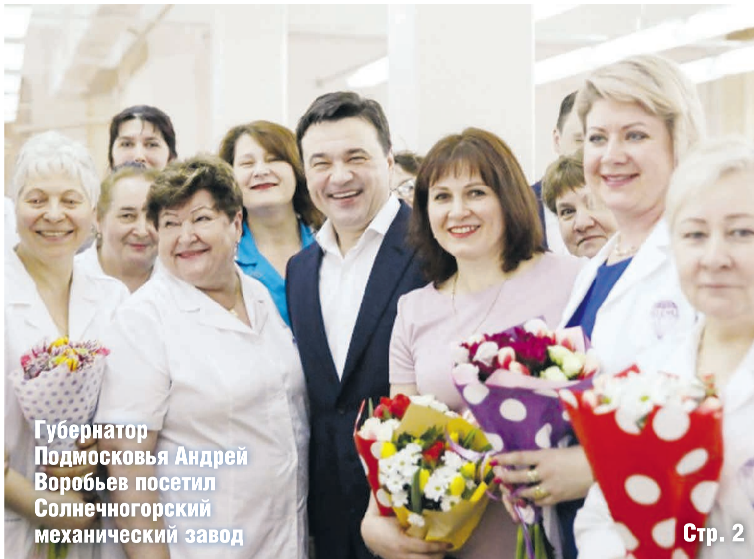
Губернатор Подмосковья Андрей Воробьев посетил Солнечногорский механический завод