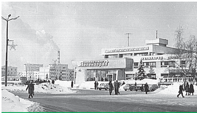
Остановка автобуса № 400 на площади Юности

Переполненный автобус первого маршрута шел в Крюково. Хмурые пассажиры были погружены в свои заботы.