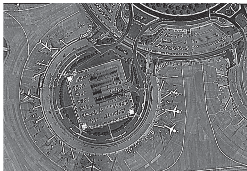
Аэропорт Канзас-Сити, США

– Что касается кризиса, то заказов у предприятия меньше не стало, но оптимизма это не добавляет – часть заказов растягивается по времени, а значит,