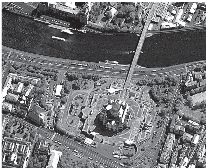
Вид сверху на Храм Христа Спасителя

Потенциальных и реальных потребителей из многих ведомств регулярно приглашают на различные совещания и советы главных конструкторов по тематике ДЗЗ Роскосмоса, а с целью совершенствования бортовых и наземных систем, уровня обработки и форм предоставления данных выслушивают пожелания и отзывы. К слову, подавляющее большинство отзывов о результатах съемки нашей аппаратурой положительные.