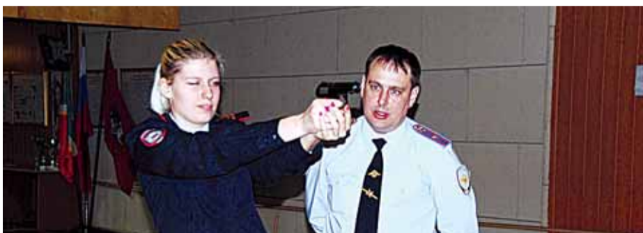
На огневом рубеже

Пресс-группа УВД по ЗелАО ГУ МВД России по Москве