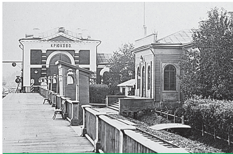
Платформа Крюково в прошлом

Вот эти дома, рядом стоят! Стала смотреть в светящиеся окна: а в них этих люстр с плафонами под хрусталь и полосатых тарелок – полно! Вычислили трехкомнатные квартиры, бросились по подъездам и этажам. Хорошо, лифты работали исправно, и подъезды тогда были открыты!