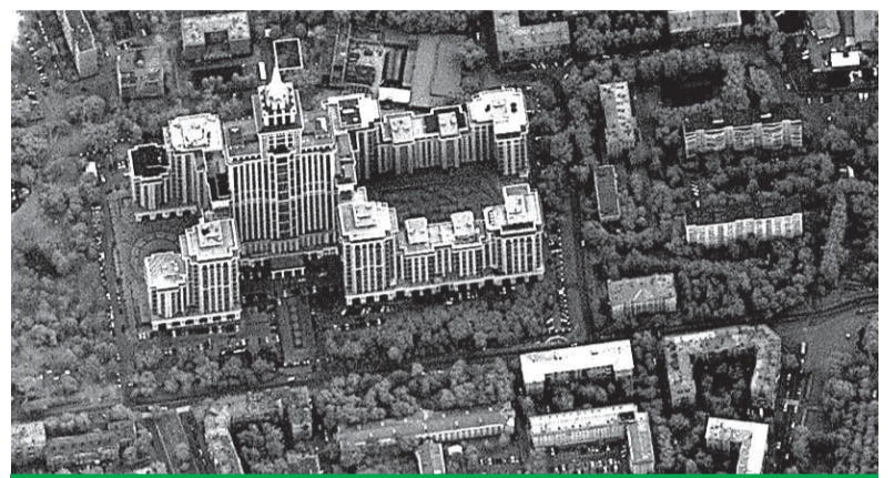
Высотка на Соколе

Первый спутник «Ресурс-П» был запущен в 25 июня 2013 г., 2-й – в декабре 2014-го. Запуск третьего намечен на 12 марта этого года.