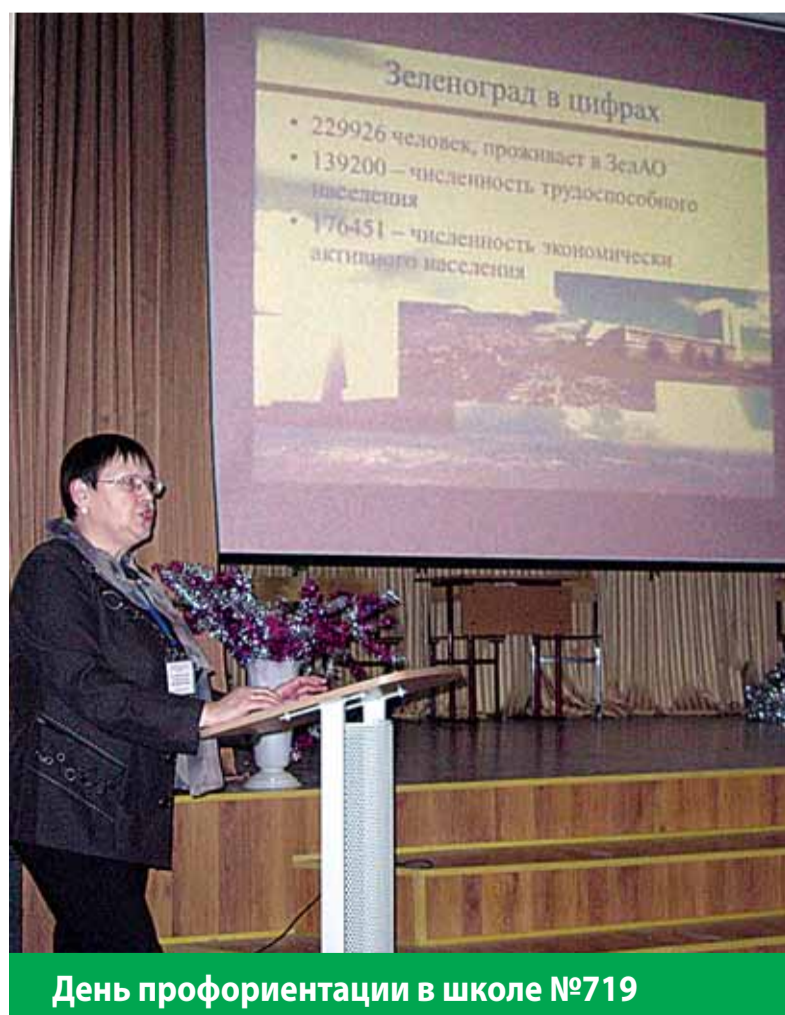
День профориентации в школе №719