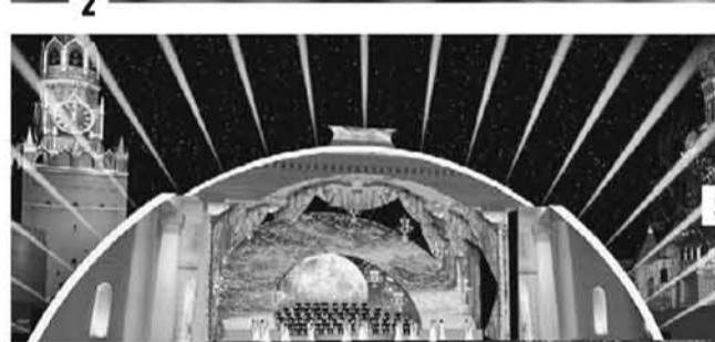
2 Проект иллюминации набережных Москва-реки 3 Проект декорации к шоу на Красной площади