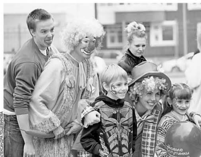
27 августа 14.39 В этот день в Новой Москве открылся детский сад в микрорайоне Новые Ватулины

Какие социальные объекты появятся в Новой Москве в ближайшие годы? В ближайшие три года на территории Новой Москвы планируется построить около 100 социальных объектов. По программе бюджетного финансирования столицы будет построено около 30 соцобъектов. В том числе школы и детские сады. Кстати, возведением этих объектов активно занимаются и инвесторы. В 2014 году на новых территориях будет построено 14 дошкольных образовательных учреждений, из них девять из внебюджетных средств и пять за счет бюджета города Москвы. Также будет возведено восемь школ, причем семь из них будут построены из внебюджетных средств и одна за счет средств города Москвы.