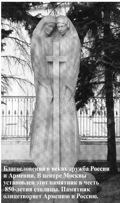
Благословенна в веках дружба России и Армении. В центре Москвы установлен этот памятник в честь 850-летия столицы. Памятник олицетворяет Армению и Россию.