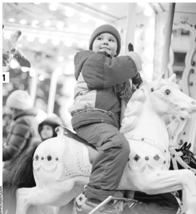
1 Детей ждут парки