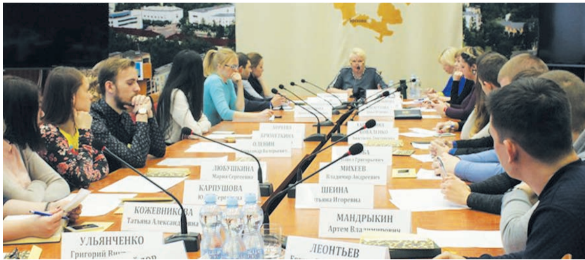
первое заседание молодежного парламента