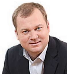
Александр Якунин, глава Солнечногорского района

«До 12,5 млн рублей увеличат господдержку предпринимательства в Солнечногорском районе»